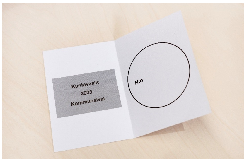
Figur 5.2 Exempel finsk neutral valedel, kommunval 2025

I april 2025 genomfördes samtida välfärdsområdes- och kommunalval i Finland. I välfärdsområdesvalet var 4 procent av rösterna ogiltiga. I kommunvalet var 1,6 procent av rösterna ogiltiga. Andelen röster som ogiltigförklarades var högre än när sådana val förrättats enskilt men något lägre än när sådana val tidigare förrättats samtidigt i Finland. 6