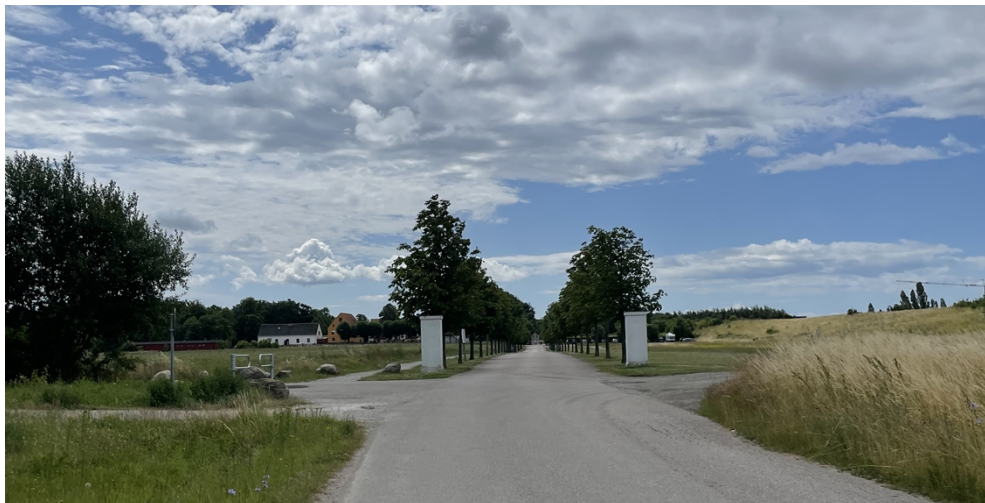
Foto. Katrinetorps allé, fotad från norr. Gång- och cykelbanan och driftsväg ansluter från vänster i bild, och en nyanlagd gångbana finns till vänster om allén som fortsätter söderut. Cyklar fortsätter i blandtrafik. Parkering för motorfordon finns till höger i bild.

Malmö har 40 km/h på de flesta lokalgator med blandtrafik, och med tanke på antalet oskyddade trafikanter på sträckan kan den jämföras med en gata i tätort. Under vissa evenemang kan trycket bli högt på vägen genom allén. En hastighetsänkning är därför motiverad för att öka trafiksäkerheten. Även motorister kan skyddas mot allvarliga