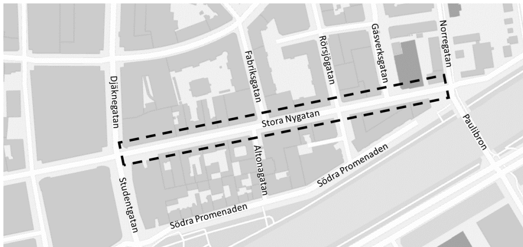
Figur 2. Markering avser den del av Stora Nygatan som fastighets- och gatukontoret studerat inom Malmöinitiativet.