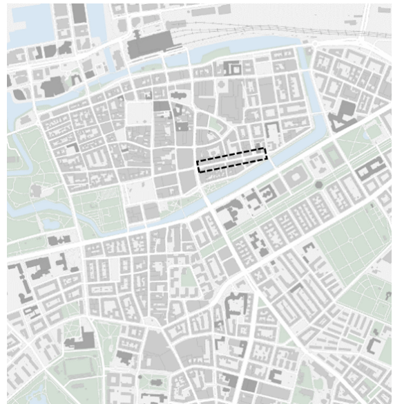
Figur 1. Östra delen av Stora Nygatan markerad. Från Studentgatan till Norregatan.

Stora Nygatan sträcker sig tvärs över Gamla staden, från Slottsgatan och det tidigare Casinot i väster, till Norregatan och Paulibron i öster. I initiativet är fokus på sträckan från Gustav Adolfs torg till Moderna Museet. Fastighets- och gatukontoret hanterar redan den del av Stora Nygatan som löper från Gustav Adolfs torg till Studentgatan inom uppdraget för storstadspaketet och delprojekt 8.1.1. Förvaltningen har därför i hanteringen av initiativet undersökt förutsättningarna på Stora Nygatan öster om Studentgatan.