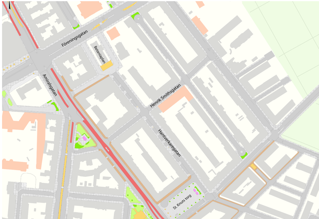
Figur 1. Översikt Hantverkaregatan med närområde.

Baserat på dialogarbetet som genomfördes med både verksamheter och boende under våren 2023 så pekades Hantverkaregatan ut som en gata där invånare upplever otrygghet i trafiken. De främsta aspekterna till upplevd otrygghet var hastigheter, trafikflöden samt att motortrafiken inte respekterar de trafikregler som finns. Hastighetsdata från Tomtom visar att 85:e percentilen är 34 km/h. Enligt STRADA, Transportstyrelsens olycksdatabas, har det de senaste tio åren rapporterats in totalt åtta olyckor på den aktuella sträckan. Inga kollisionsolyckor mellan oskyddade trafikanter och motorfordon har rapporterats in. Det har skett två kollisionsolyckor mellan motorfordonstrafik, varav en i korsningen med Henrik Smithsgatan. Resten av olyckorna är singelolyckor.