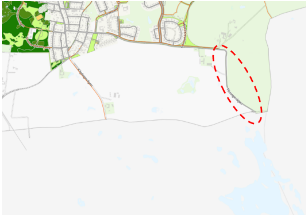
Figur 2 Översikt över aktuell sträcka, som visar cykelvägnätets utbredning (orange). Inringad sträcka är den i initiativet efterfrågade.

En mätning av cykeltrafik från 2022 vid Rönnebacksvägen (där cykelbana idag upphör) visade på 30 cyklister per dygn. Medelvardagsdygnstrafiken (MVD) avseende motortrafik visar på 300 f/d (2022).