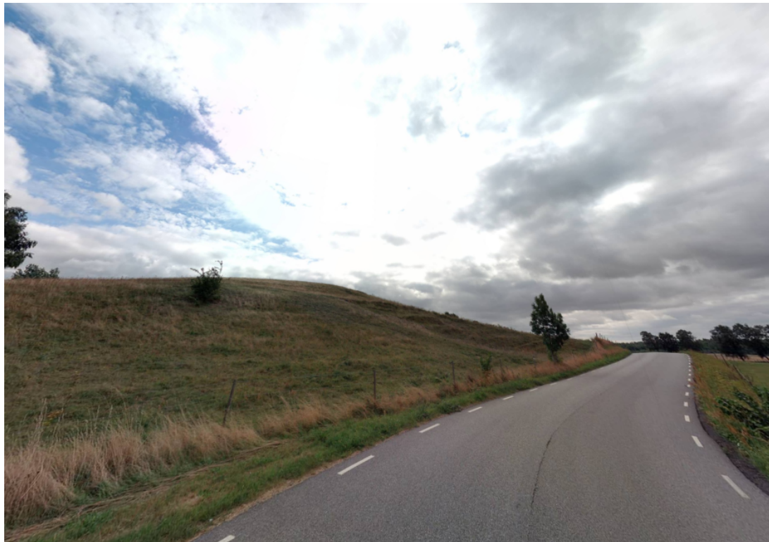
Figur 3 Vy från Törringevägen. Till vänster fastighet som ligger inom Malmö stads gränser.

Av Riksantikvarieämbetets fornsök framgår att ett boplatssområde påträffats vid utgrävningar på fastigheten. Påträffade härdar är undersökta och borttagna.