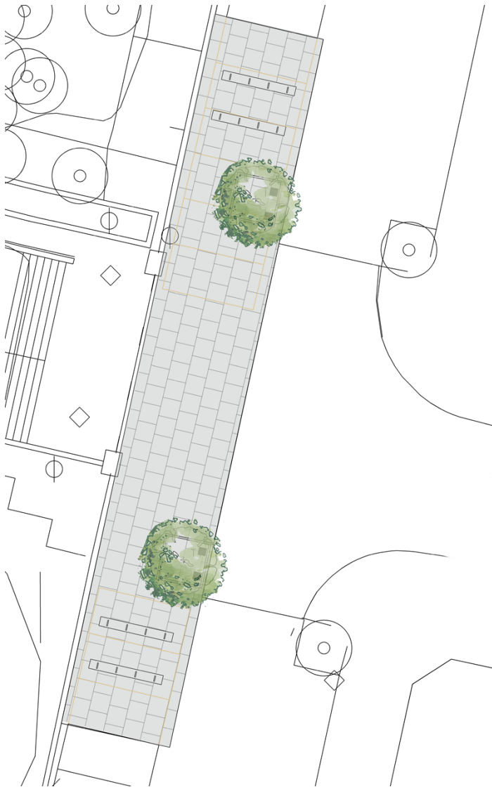
Figur 4. Skiss över entrén vid Trelleborgsgatan (Barnens scen-entrén) med två nya träd och cykelställ.