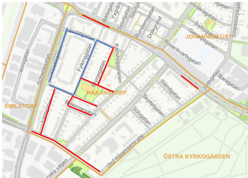
Figur 1. dagens parkeringsregleringar i Håkanstorp. Blått är parkeringsavgift taxa D. Rött är tidsbegränsad parkering med p-skiva. Majoriteten av gatorna i Håkanstorp är redan reglerade med någon typ av parkeringsreglering.

På senare år har fler och fler ärenden från boende och verksamma i området kommit in till förvaltningen om att parkeringsbeläggningen på de oreglerade gatorna i Håkanstorp är hög och att det i vissa fall påverkar framkomligheten, framför allt på smalare bostadsgator.