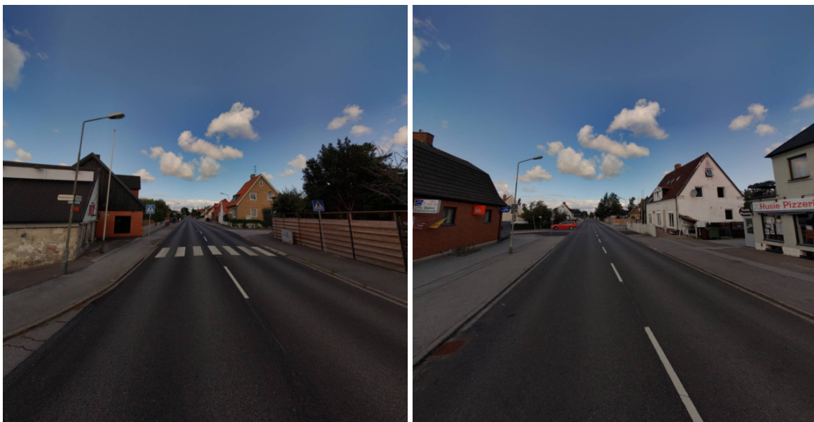
Figur 2-3: Exempel på platser med behov av hastighetsdämpande åtgärd

Förslaget är att anlägga hastighetsdämpande åtgärder vid två punkter på Klågerupsvägen mellan Videdalsvägen och Husieskolan. Exakt placering av åtgärderna behöver utredas närmare för att säkerställa att effekten blir så god som möjligt och att placeringen upplevs logisk och underlättar för gående att korsa vägen. Enkla farthinder i form av asfaltsgupp bedöms vara lämpliga i denna trafikmiljö. Åtgärderna bedöms kunna finansieras inom redan beslutade budgetramar.