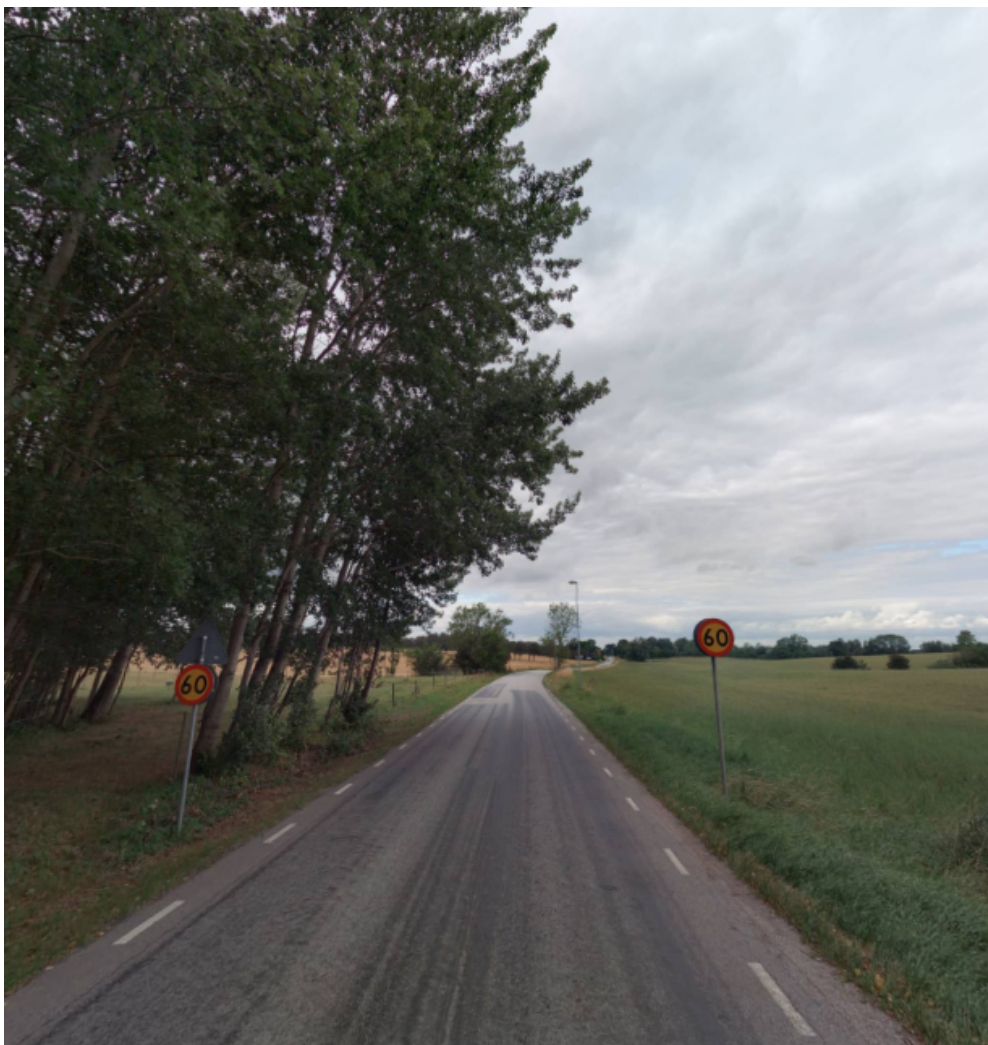
Figur 2: Gatny från norra delen av Fårabäcksvägen