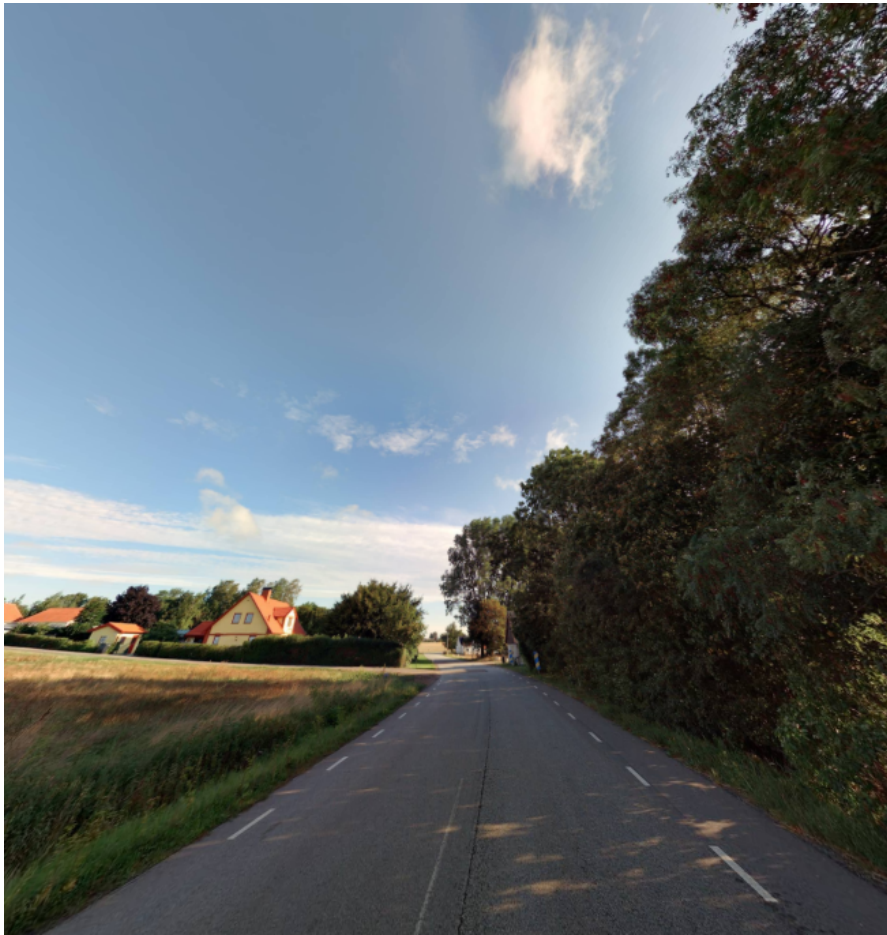
Figur 1: Gatny från södra delen av Fårabäcksvägen