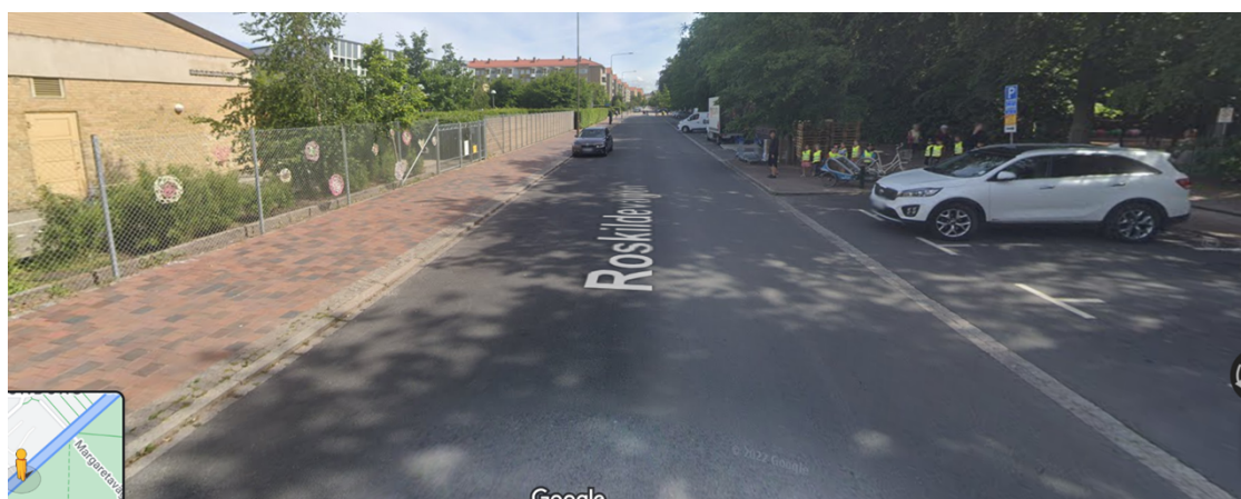
Bild 2. Vy norrut över Roskildevägens mittersta del utanför Bladins grundskola.

På Roskildevägens sträcka mellan Carl Gustafs väg och John Ericssons väg finns det fartdämpande åtgärder i form av två upphöjda korsningar i Ribevägen och Margarettavägen samt ett övergångsställe med farthinder strax norr om Ribevägen.