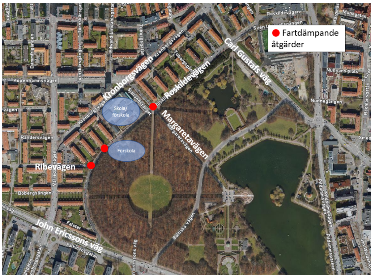
Bild 3. Karta som visar var Bladins grundskola och förskola samt förskolan Stock och Sten finns. Kartan visar även platser med fartdämpande åtgärder.

Roskildevägen hör till det övriga huvudcykelvägnätet. Det gör även Kronborgsvägen som löper parallellt med Roskildevägen och längs denna planeras en separerad cykelbana att byggas inom Storstadspaketet tidigast år 2026. Den nya cykelbanan kopplas då till det prioriterade huvudcykelvägnätet. Det är inte aktuellt att bygga en cykelbana även på Roskildevägen eftersom den har relativt låga trafikmängder och därför i grunden fungerar väl som en blandtrafikgata.