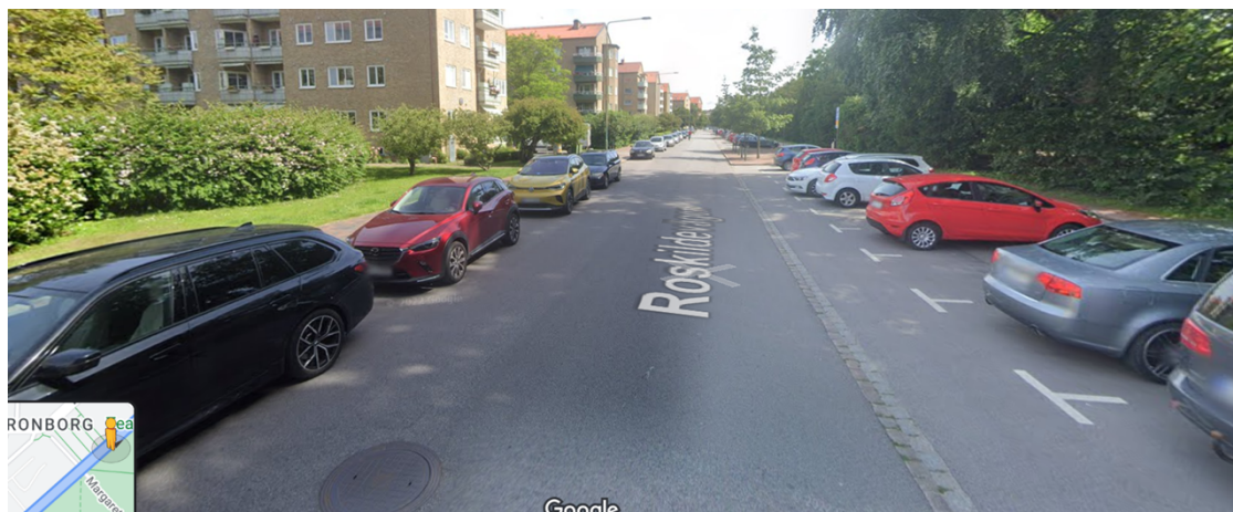
Bild 1. Vy norrut över Roskildevägens norra del.