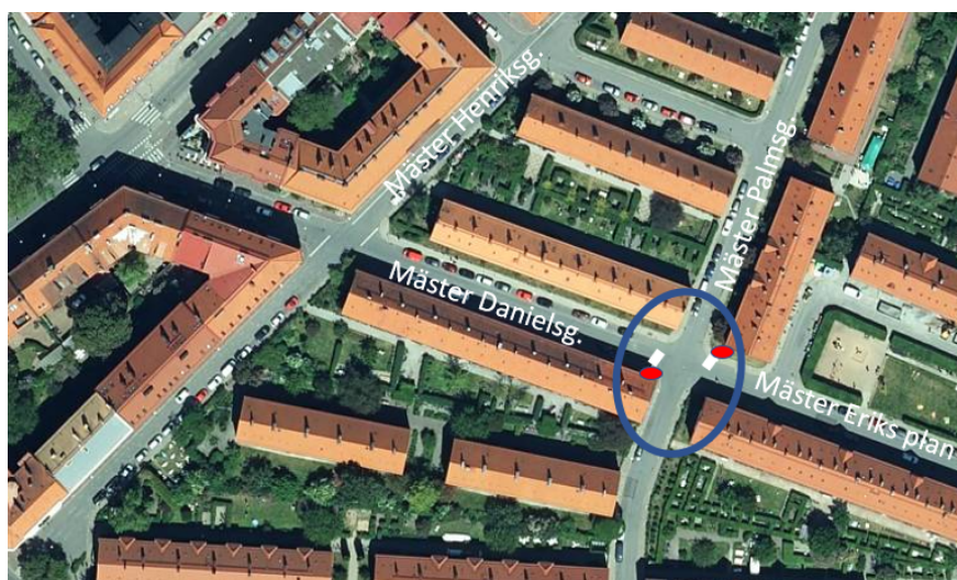
Stopplikt föreslås på Mäster Danielsgatan i korsningen med Mäster Palmsgatan.