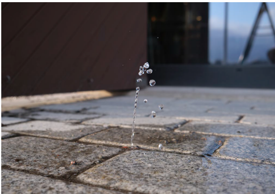
Bild beskriver hur verket ser ut.

”Fountain” av Magnus Thierfelder Tzozis är en liten, liten fontän som ska få en lämplig placering på Ola Billgrens plats. Verket kommer placeras permanent på platsen. Det är Moderna museet som äger verket och som har ansvar för drift, underhåll och förvaltning. Malmö stad får därigenom tillgång till ett offentligt konstverk.