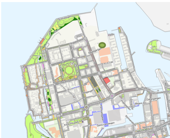
Figur 1 Naboland 3, fastigheten är markerad med röd färg. Planerad park i Dp5767 markerad med grön markering.

även ett stort behov av förskolor i Västra hamnen och det är därför av stor vikt att den planerade förskolan på fastigheten blir av. Därför bedömer nämnden att det inte är lämpligt att ändra detaljplanen för en utökad park och avser inte att köpa fastigheten. Nämnden vill även framföra att Malmö stad utvecklar grönstrukturen i hela Västra Hamnen. Bland annat planeras det längre norrut en ny park i kvarteret Kranen 5 i den ännu ej antagna detaljplanen Dp 5767.