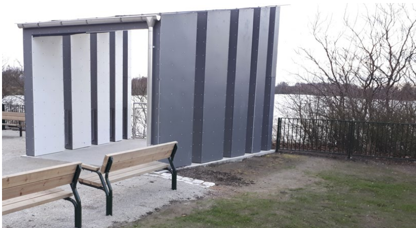
Paviljong på utsiktsplats fick en mer hållbar utformning under projekteringskedet 2017-2018