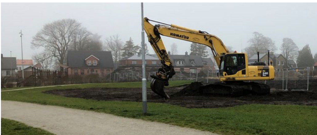
Skadegörelse i parken januari 2020

50 st träd i naturdunge avverkades i januari 2020. Ett förlikningsavtal skrevs med Bodeborn gräv AB, där skadegöraren skulle betala trädens återanskaffningsvärde, enligt Alnarpsmodellen. Den verkliga kostnaden för återplantering, administration och skötsel var ca 500 tkr mer än den återbetalda summan. Företaget gick i konkurs 2020 och endast 300 tkr betalades in, av 500,251 tkr.