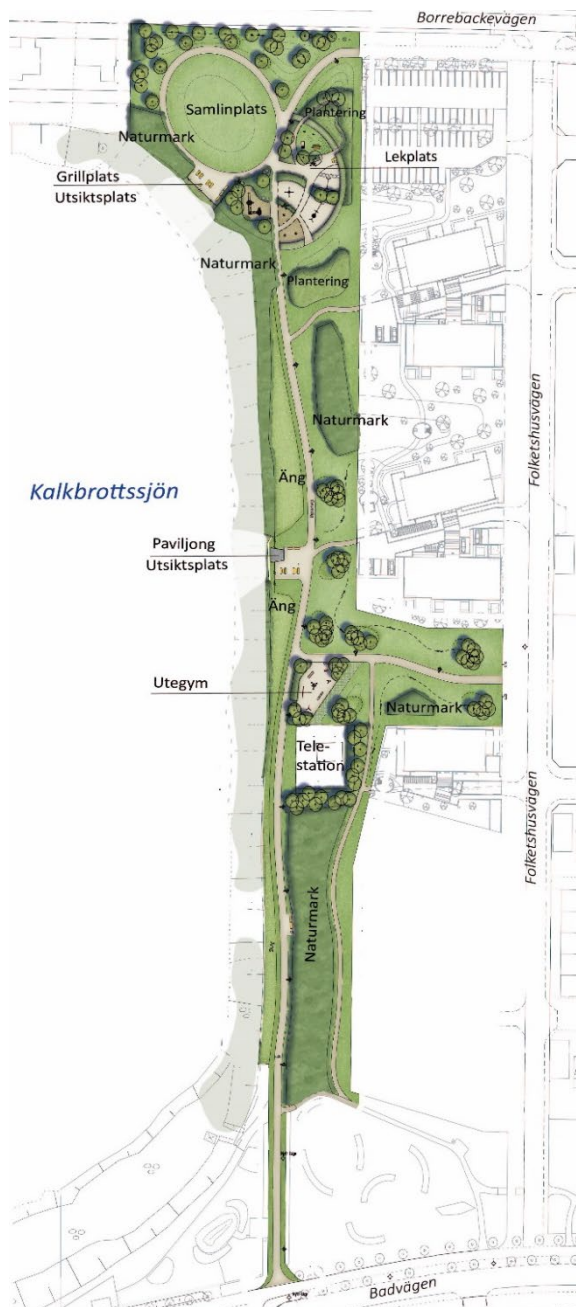
Översikt för Etapp 4, Klagshamn Syd