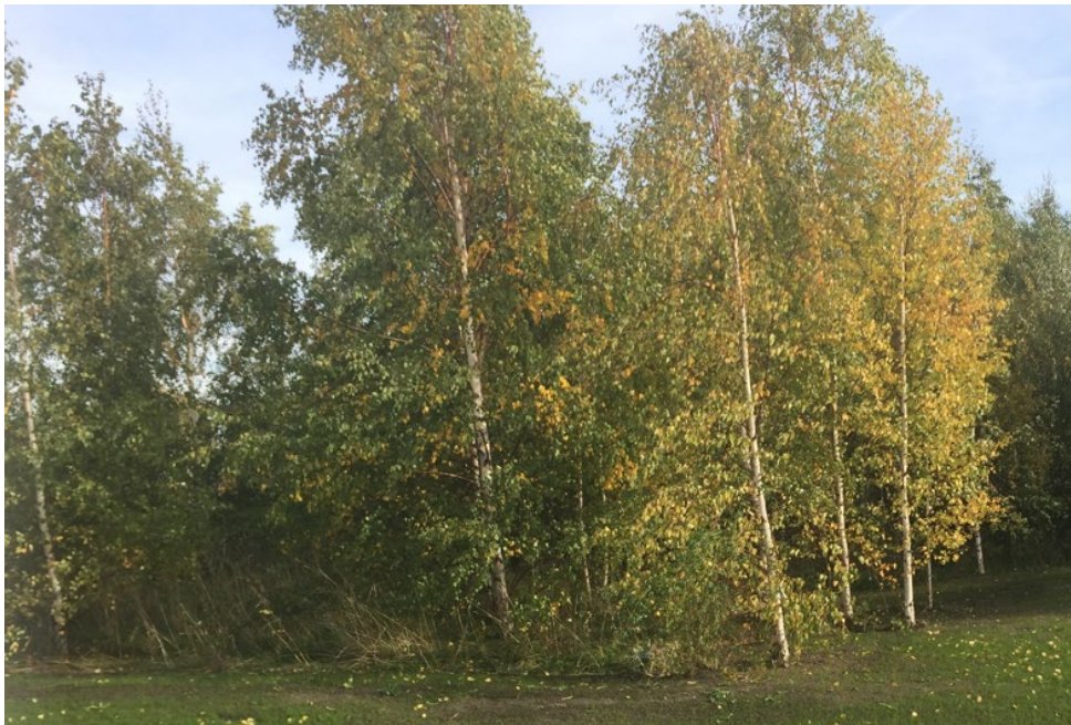
40st björkar och 10st ekar, ca 10 år gamla, som avverkades jan 2020