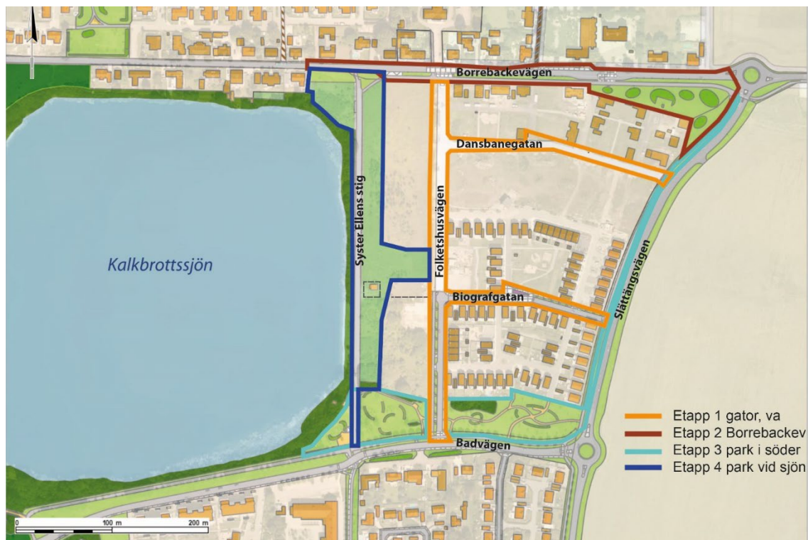
Etappindelning inom utbyggnadsområdet Klagsbamn syd, 8410

För etappindelning (1-4) se översikt nedan.