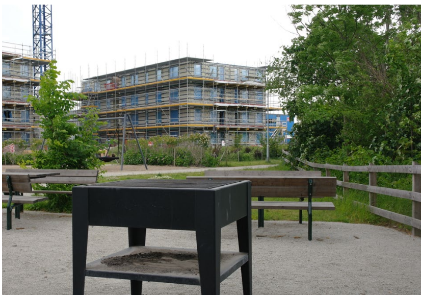
Grillplats med utsikt över Kalkbrottsjön