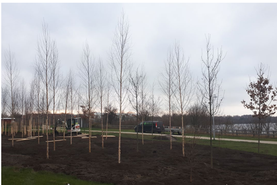
Ersättningsplantering av träd dec 2020