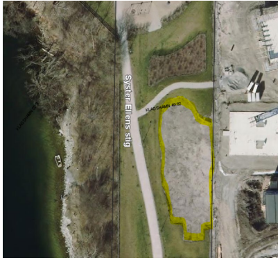
Den ca 560 m 2 stora ytan som avverkades