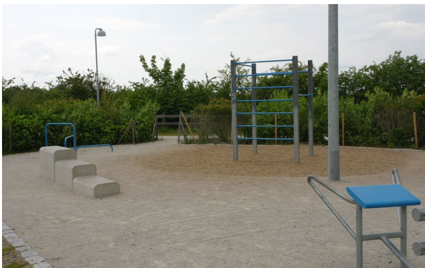
Utegy, med standardredskap och några tillägg (ribbstol mm) som boende hade önskemål om