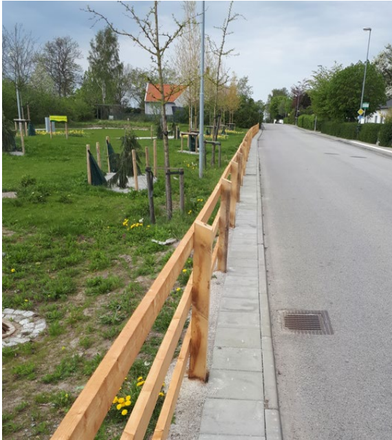
Ekstaket mellan park och Borrebackevägen

Staketet sattes upp efter att cyklister börjat snedda genom parken och över Borrebackevägen. Den gamla vägen saknar gångbana på södra sidan och att korsa vägen innebär en stor risk, särskilt där buskar och fastigheter skymmer sikten.