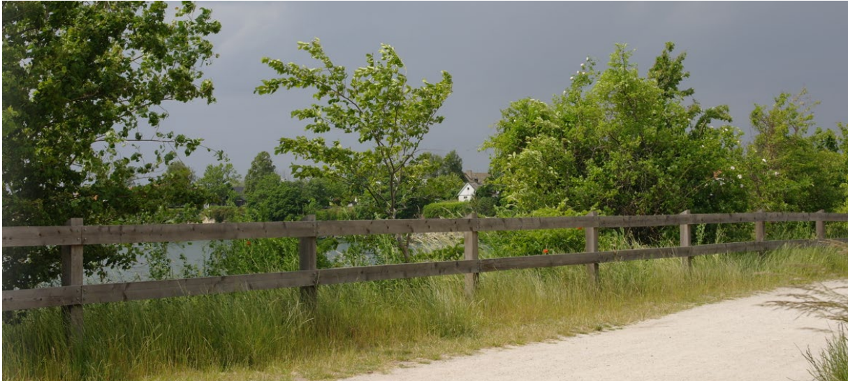
Befintligt bussräckes ersattes med ekstaket längs hela sjökanten

De befintliga bussracket i stål var i sämre skick än förväntat och ett nytt förslag för räckes togs fram av projekteringssektion och ekolog. Att räckes skulle gå längs hela parken var ett viktigt beslut. Många barn rör sig genom parken, längs sjön, och ett sammanhängande och högre staket ökar säkerheten och tryggheten i parken.