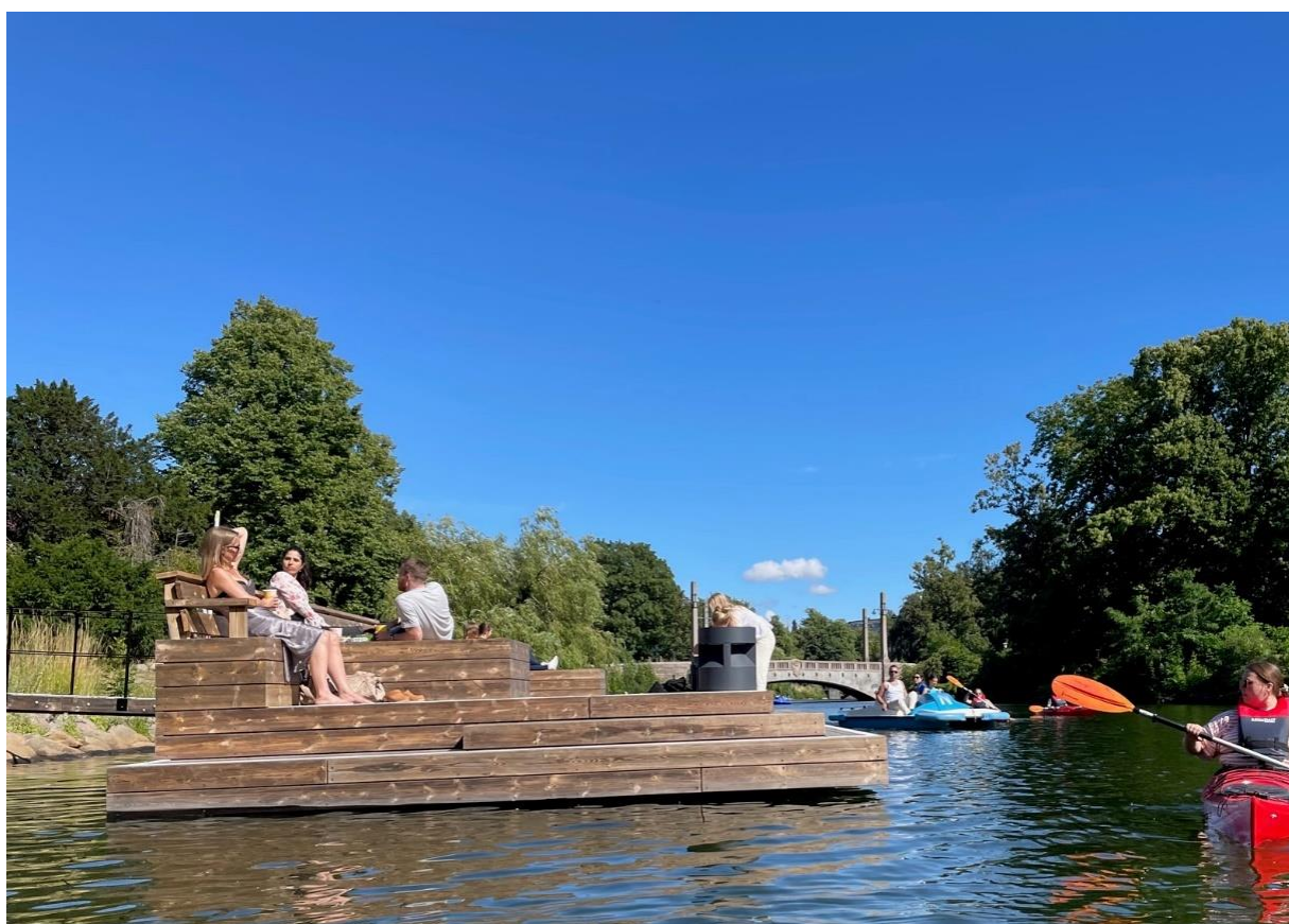
Bryggan vid Bergbults trädgård