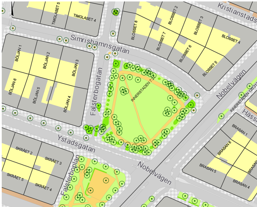
Områdeskarta med omgivande gator.

Skulle eventuella satelliter tillfogas huvudverket förankras platser för dessa i TNAU.