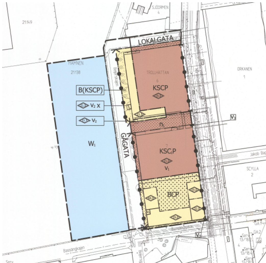
Figur 2: Utsnitt av gällande detaljplan för området

En del av genomförandet av projekt Trollhättan innebär att Beijerskajen kommer att renoveras. Objektsgodkännande för projekt Trollhättan antogs av tekniska nämnden 2017. Under projektets gång har det framkommit att kajens tekniska skick är sämre än förväntat. De befintliga dragstagen har en beräknad kvarvarande livslängd på ca. 20 år. Vidare har det framkommit att kajens spont, som anlades på 60-talet kan ha en kvarvarande teknisk livslängd på ca 20 år. En ny spont behöver anläggas ungefär två meter utanför den befintliga vilket förändrar det kajplan som är planerat att genomföras.