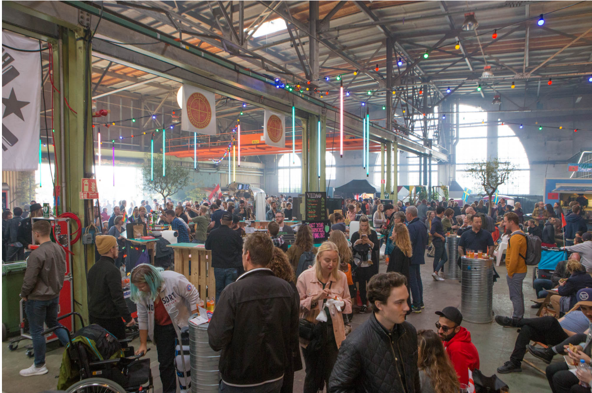
Miljöbild European Street food awards, Kockums 2019