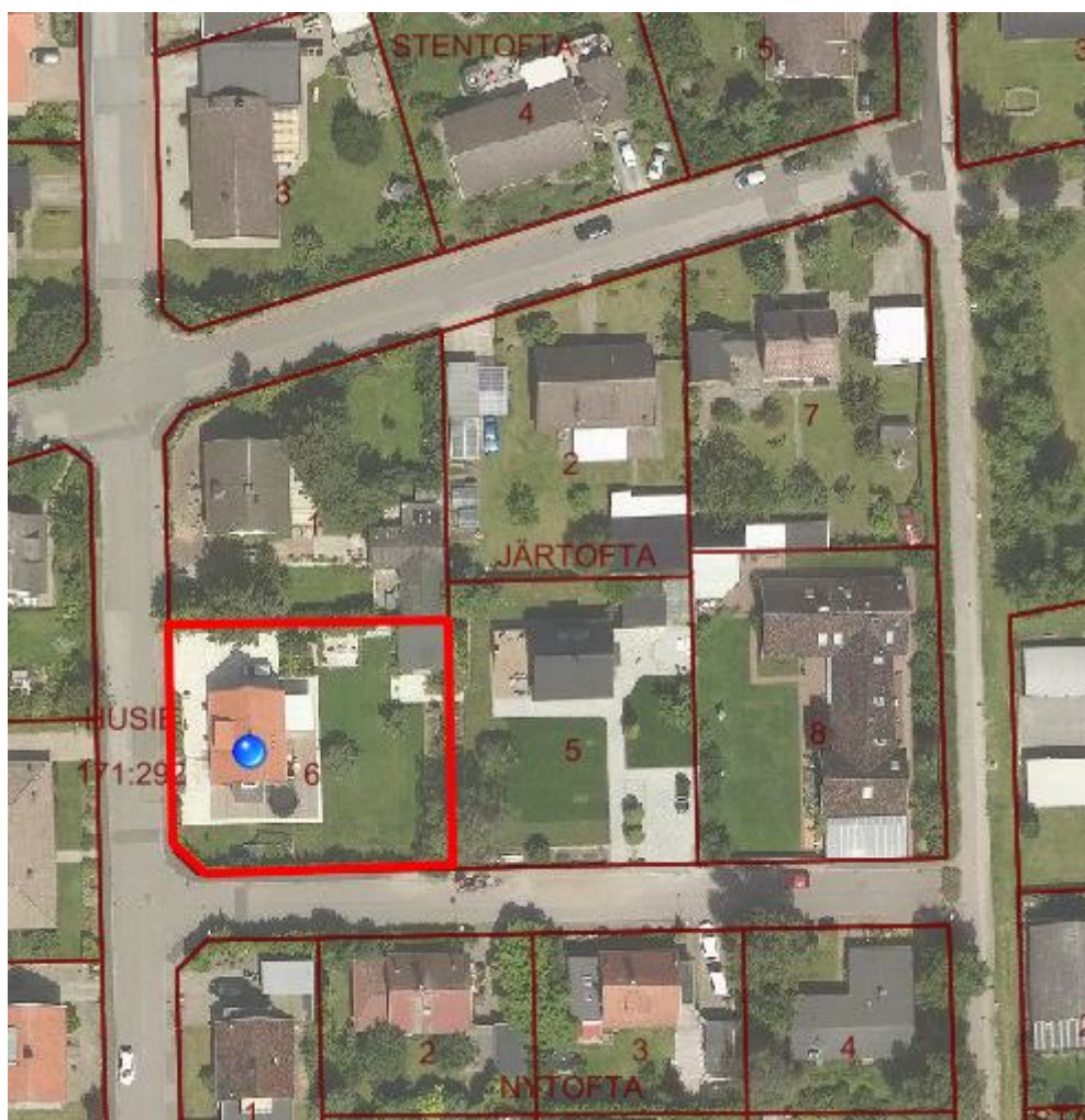
Flygfoto över planområdet.

Planområdet består av fastigheten Järtofta 6. Fastigheten ägs av en privatperson. Järtofta 6 har en areal om 1002 kvadratmeter och är bebyggd med ett bostadshus. Fastigheten gränsar i väster till Hallstörpsvägen och i söder till Lindbogatan.