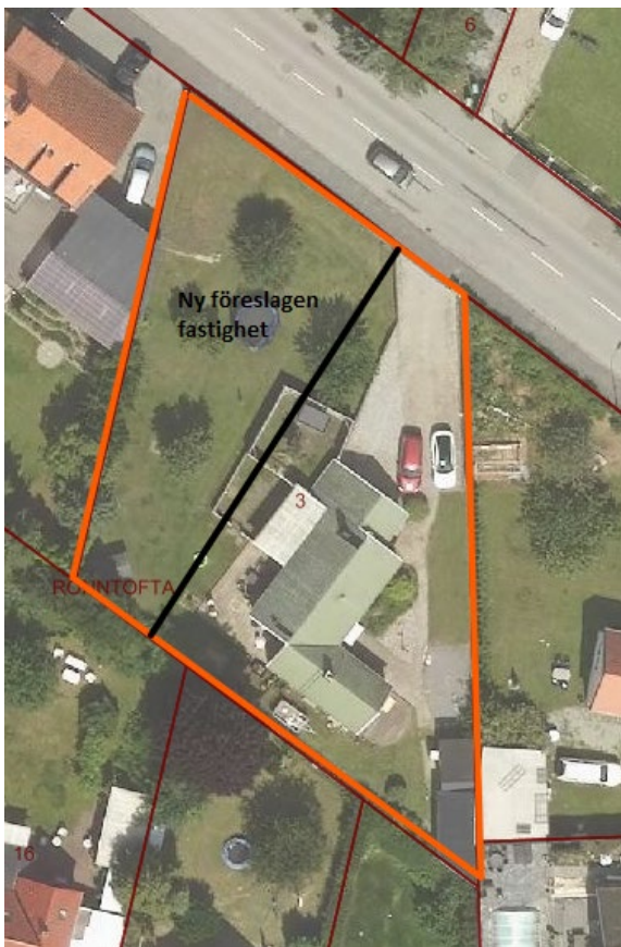
Fotokarta på planområdet inritad med rött och förslag på ny fastighet

Syftet med ändring av detaljplanen är att göra det möjligt att förändra fastighetsindelningen för Rönntofta 3 genom att ta bort fastighetsindelingsbestämmelsen.