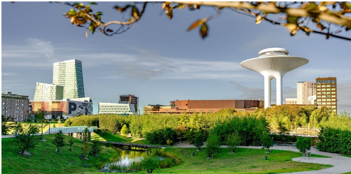
Bild med utsikt över Hyllie från Dagvattenparken.