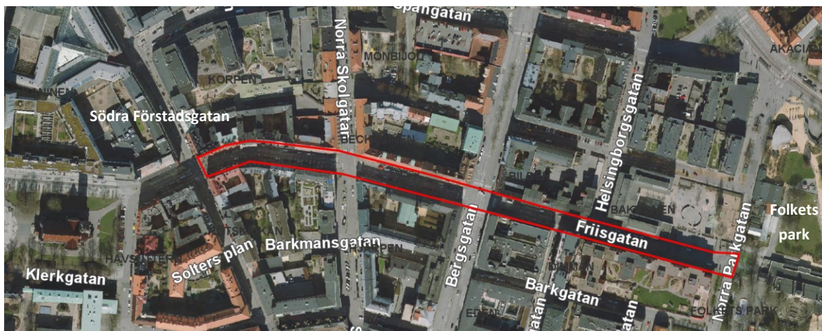
Figur 2 I förstudien studerades Friisgatan på sträckningen från Södra Förstadsgatan till Norra Parkgatan.

Fastighets- och gatukontoret har under 2021 tagit fram en förstudie som tar ett helhetsgrepp om en längre del av Friisgatans sträckning. I denna förstudie har sträckningen ända från Södra Förstadsgatan till Norra Parkgatan studerats.