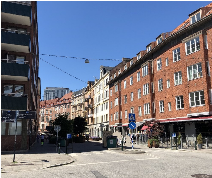
Figur 3 Friisgatan som sommargata sett från Norra Skolgatan

Den permanenta grönska som i dagsläget finns längs gatan utgörs av enstaka träd vid korsningen med Södra Förstadsgatan. Körbanan längs hela Friisgatan är asfalterad och trottoarerna är belagda med betongplattor samt med smågatsten vid infarter. Beläggningen på sträckan mellan Södra Förstadsgatan och Bergsgatan är i särskilt dåligt skick, och behovet av ny beläggning här är stort.