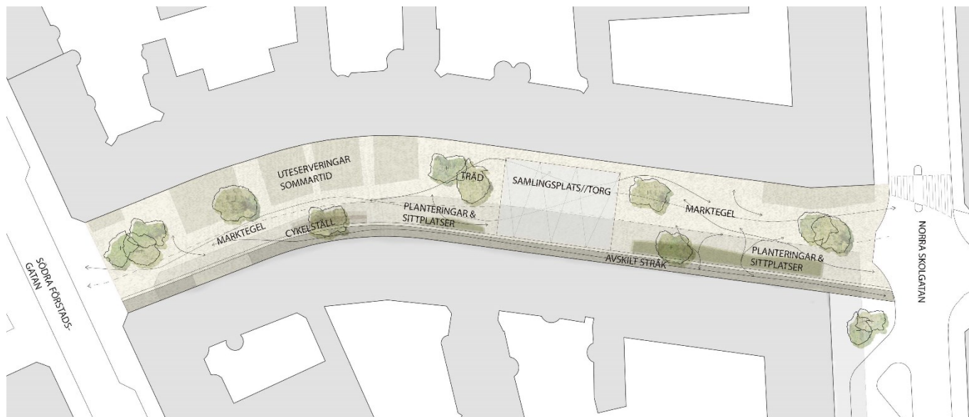
Figur 4 Illustration av Friisgatan, sträckan Södra Förstadsgatan till Norra Skolgatan, som gågata.

Mindre åtgärder planeras även i korsningen med Norra Skolgatan, för att skapa en tydlig och lättillgänglig passage till Friisgatans resterande sträckning. Utformningen av korsningen med Södra Förstadsgatan kommer i sin tur att samordnas med det projekt som pågår där.