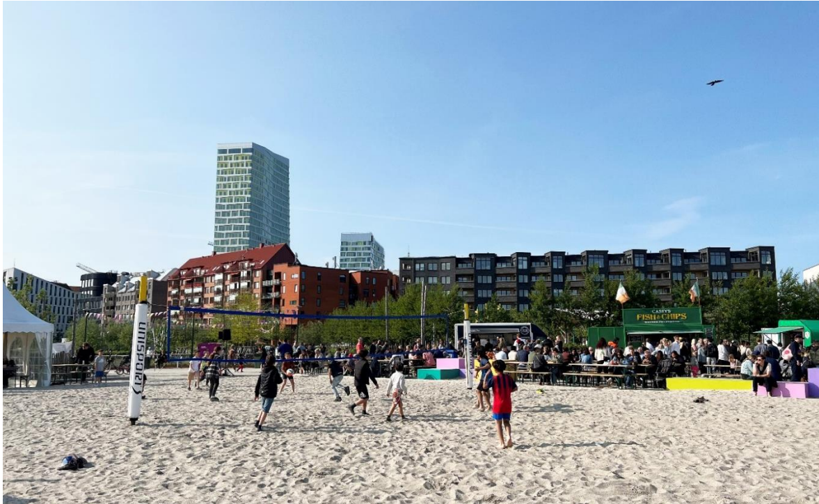
Bild från Swedish Street Food Awards 2023, Hyllievångsparken