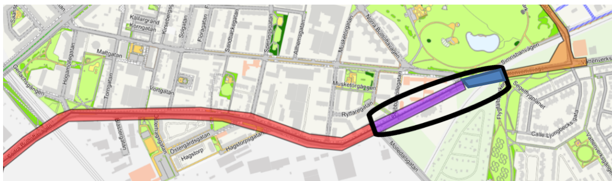
Figur 2 Kartbild som visar entreprenaderna, röd och orange. Svart markering är sträckan som föreslås ingå i Malmö stads förbättringsåtgärder. Lila sträcka omfattar det VA SYD planerar återställa till befintlig utformning och blå sträcka är det sträckan mellan entreprenaderna.

När objektsgodkännandet togs fram 2021 var det inte känt att entreprenaderna skulle utföras i samarbete med VA SYD. Södra Bulltoftavägen och delar av Vattenverksvägen byggs om under 2023-2025. Sträckan är indelad i två entreprenader. Entreprenaderna (röd respektive orange markering i figur 1) är nu upphandlade tillsammans med VA SYD.