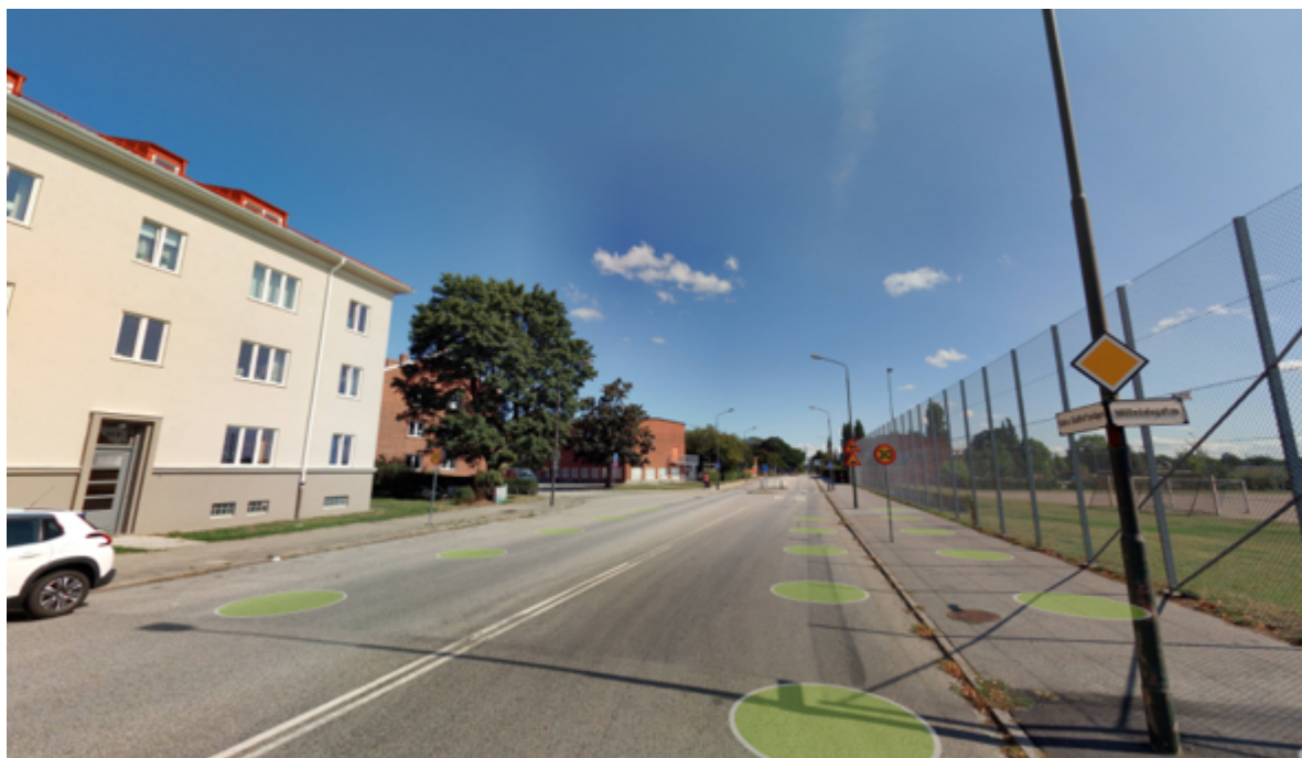
Figur 3 Gatny av befintlig utformning längs Södra Bulloftavägen.

visar brister avseende bland annat trafiksäkerhet, utförs en breddning av gång- och cykelbana, hastighetssäkring av övergångsställe och flytt av belysningsstolpar på den södra sidan. På den blå sträckan i figur 2 innebär åtgärderna enbart en separering av gång- och cykeltrafik med plattläggning. Föreslagna åtgärder beräknas innebära en merkostnad på omkring 1,5 mnkr för Malmö stads delar, vilket ryms inom objektsgodkännandets budget.