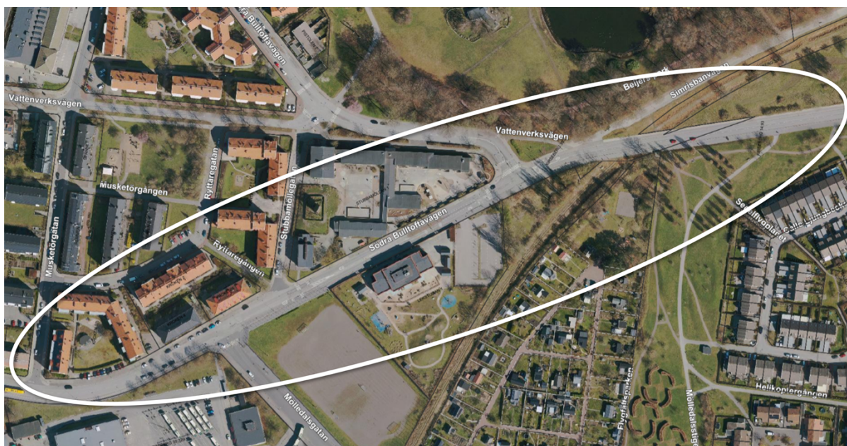
Figur 1 Kartty och markering runt sträckan den geografiska utökningen ärende avser

kollektivtrafikfrämjande åtgärder samt åtgärder som främjar framkomligheten för cykeltrafik. Objektsgodkännandet för 4.2 (3315) Kirseberg gäller sträckan mellan Hornsgatan och Segemöllegatan, där Södra Bulltoftavägen och Vattenverksvägen är delsträckor.