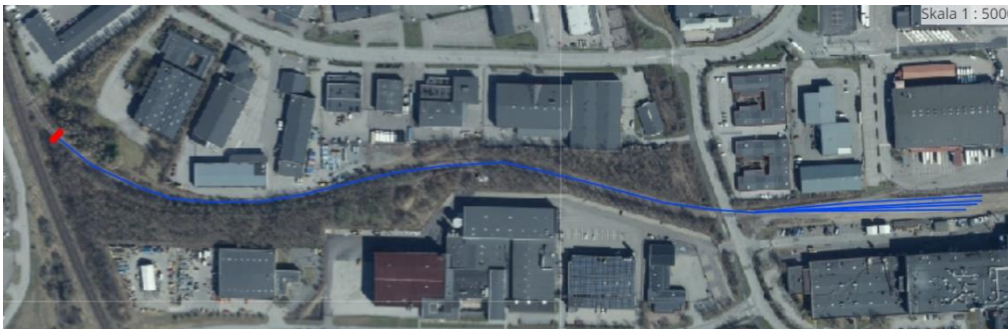
Figur 3: Blå sträckning visar spår som är borttaget av Malmö stad och ledde in till företag som förut bedrev transporter på järnväg. Röd markering är där Malmö stads del av spår 60 slutar idag.