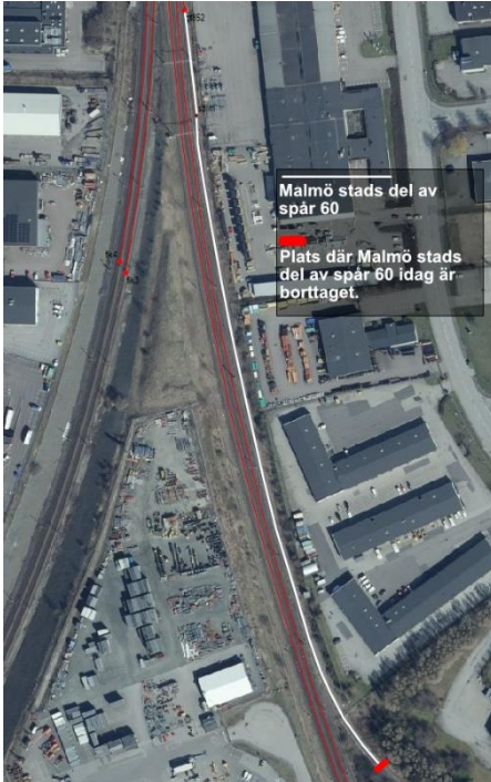
Figur 2: Visar Malmö stads del av spår 60 som inte är rivet samt vart spåret slutar idag.