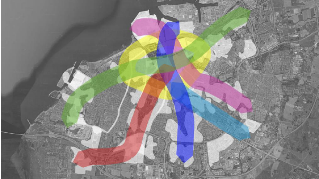
Figur 1. Identifierade möjliga korridorer för supercykelstråk.

Fastighets- och gatukontoret fick 2019 i uppdrag att ”utreda möjliga supercykelstråk”. Förvaltningen har därefter genomfört ett utredningsarbete som utmynnat i en rapport som innefattar förutsättningar för supercykelstråk. Potentiella stråk och förslag till fortsatt arbete summerades.