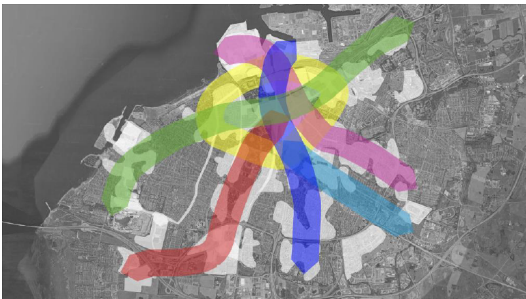
Figur 1. Identifierade möjliga korridorer för supercykelstråk.

Tekniska nämnden fick under 2021, tillsammans med stadsbyggnadsnämnden, i uppdrag av kommunfullmäktige att ”under mandatperioden påbörja processen med att bygga ett supercykelstråk”.