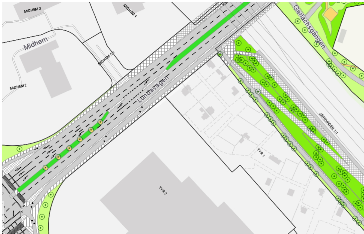
Figur 4 Karta som visar mittdelen.