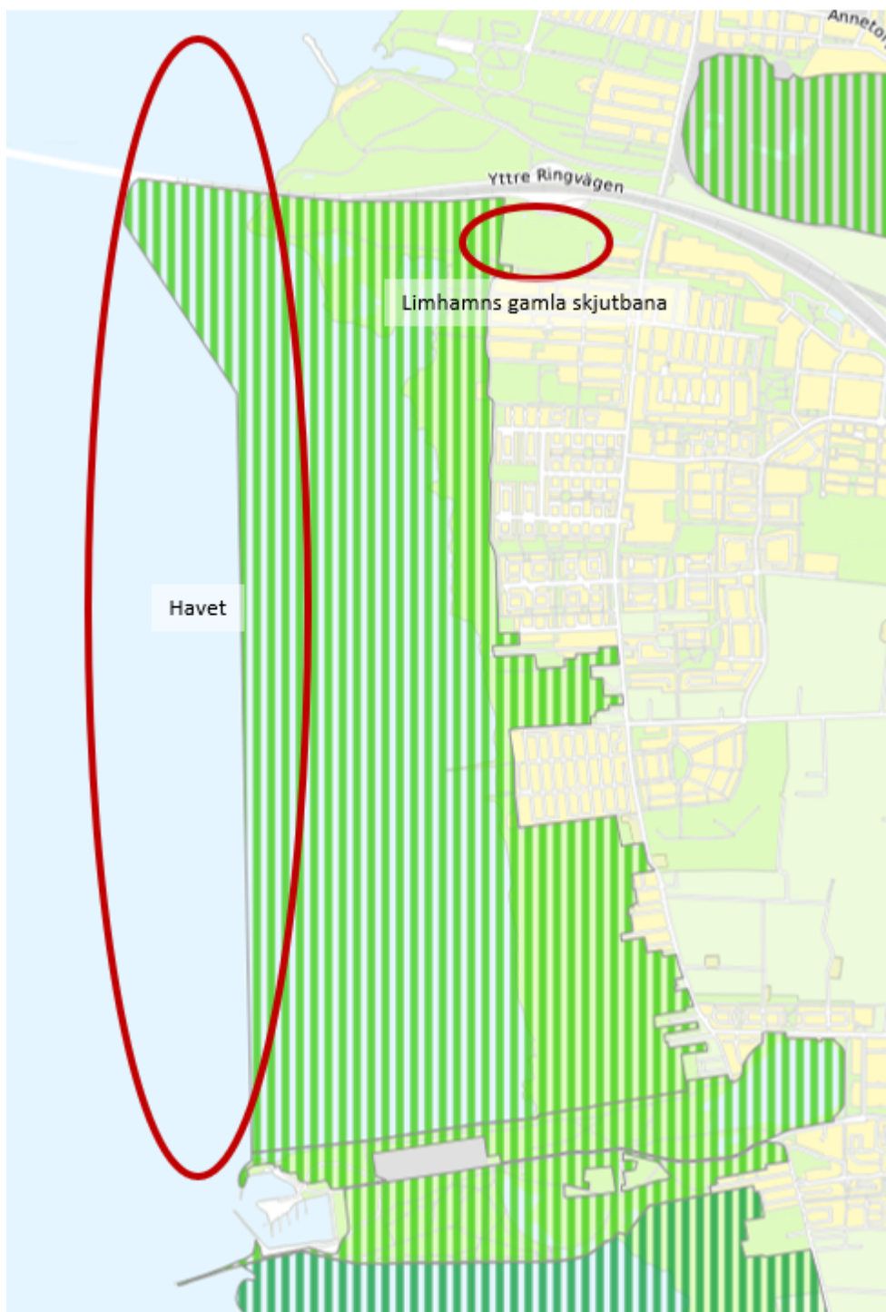
Figur 2. Utredningsområden för utökning av utökning av Bunkeflo strandängars naturreservat.