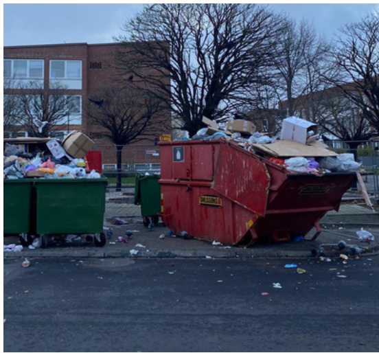
En av felanmälningar