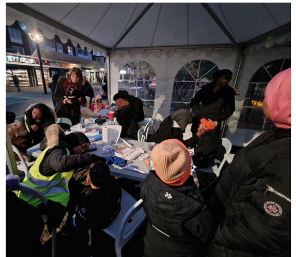
Ansiktsmålning på Hållbarhetsdagen