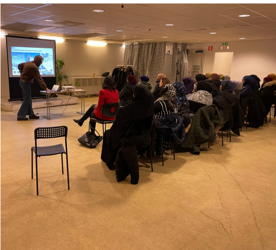
Mammor från Rosengård på utbildning