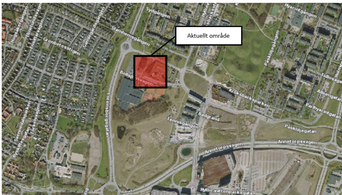
Figur 1 Översiktskarta med aktuellt område markerat, Bollspelsvägen.

För att säkerställa Malmös framtida elnät vill E.ON nyttja hela fastigheten vilket innebär att nuvarande in/utfartsväg till Hyllie sportcenter måste rivas till fördel för en större nätstation.