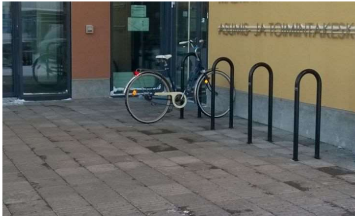
Figur 1. Bild på aktuell modell av cykelbåge som anlagts i Malmö.

Ovan redovisade siffror är enligt budgetuppdraget. Inom befintligt objektsgodkännande 9250 Cykelparkering 2020–2022 har ytterligare 86 nya cykelbågar anlagts. Totalt har förvaltningen anlagt 397 nya cykelbågar i Malmö.