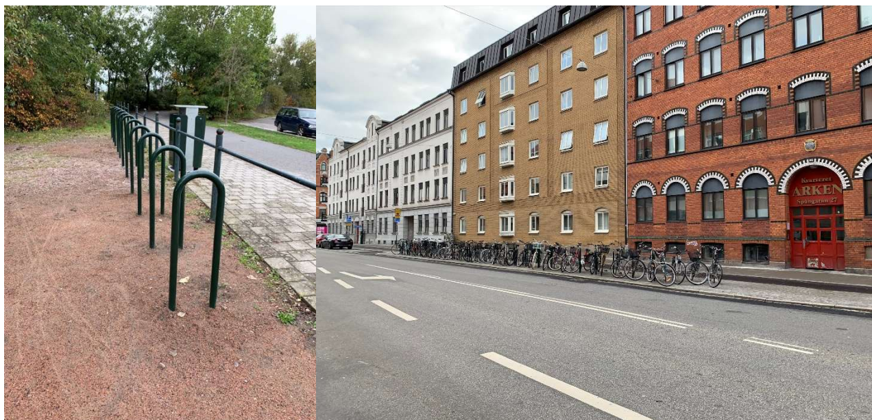
Figur 3. Exempel på ny cykelparkering vid Scaniabadet och HPL Spångatan.