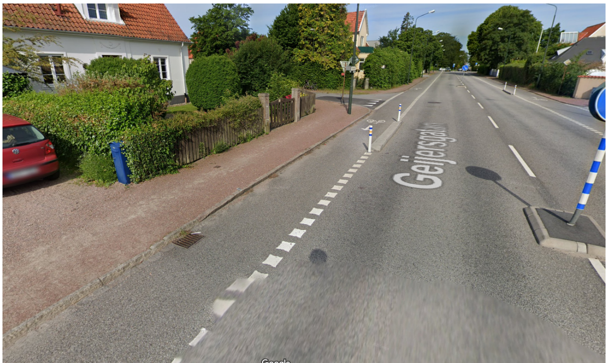
Bild 2. Befintliga cykelkörfält längs Geijersgatan