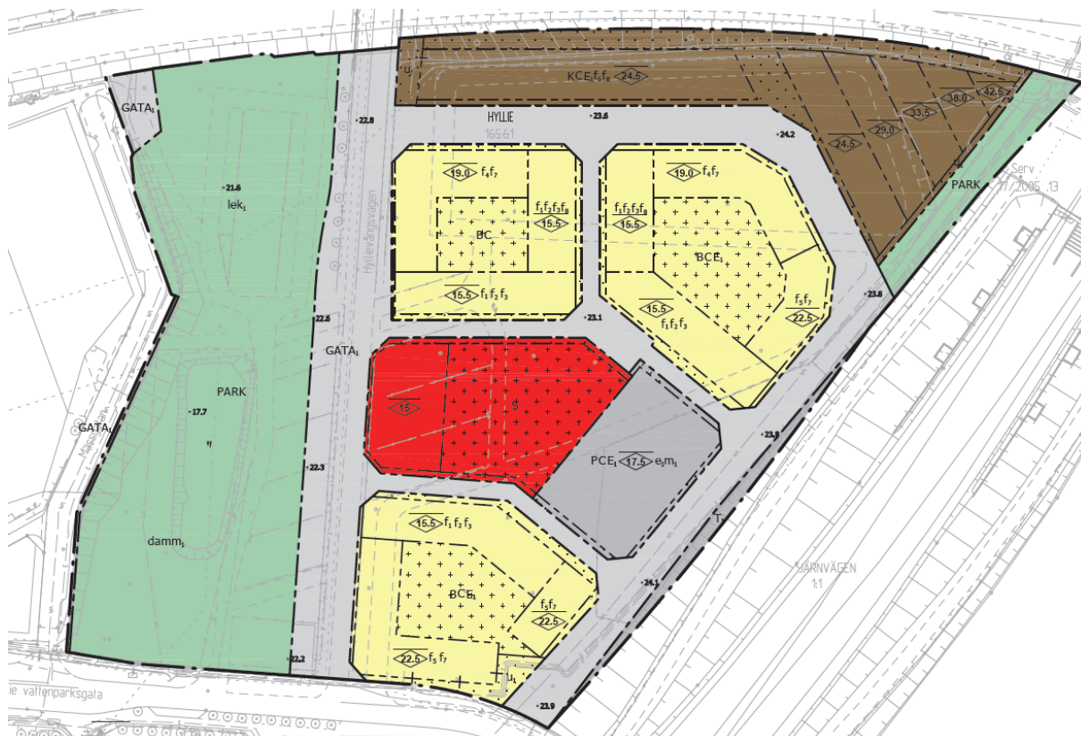
Figur 2. Utdrag ur plankartan för detaljplan 5530, från granskningshandlingarna.

Inom området möjliggörs även ett parkstråk som kopplar ihop Kroksbäcksparken med Hyllie vattenpark. Inom parken ryms både en dagvattendamm som tar emot dagvatten från stora delar av Hyllie och en områdeslekplats. Detaljplanen omfattar även delar av Hyllievångsvägen, som kopplar ihop planområdet med Holma. Projektet kommer att bidra till en fortsatt blandad stadsbebyggelse i ett stationsnära läge.