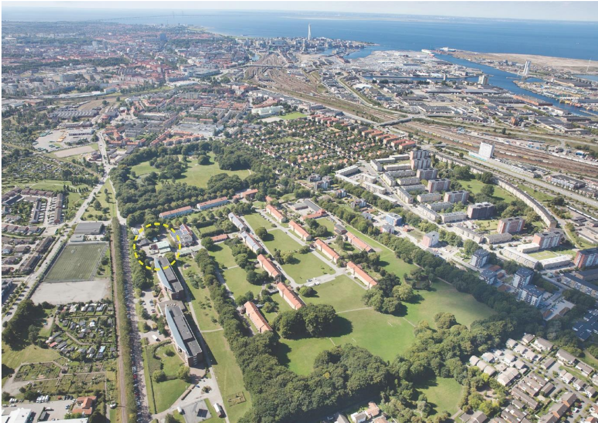
Malmö november 2018 En nod för delningstjänster i Sege Park

Fastighets AB Trianons planer för Terapisalen 2/Byggnad 14