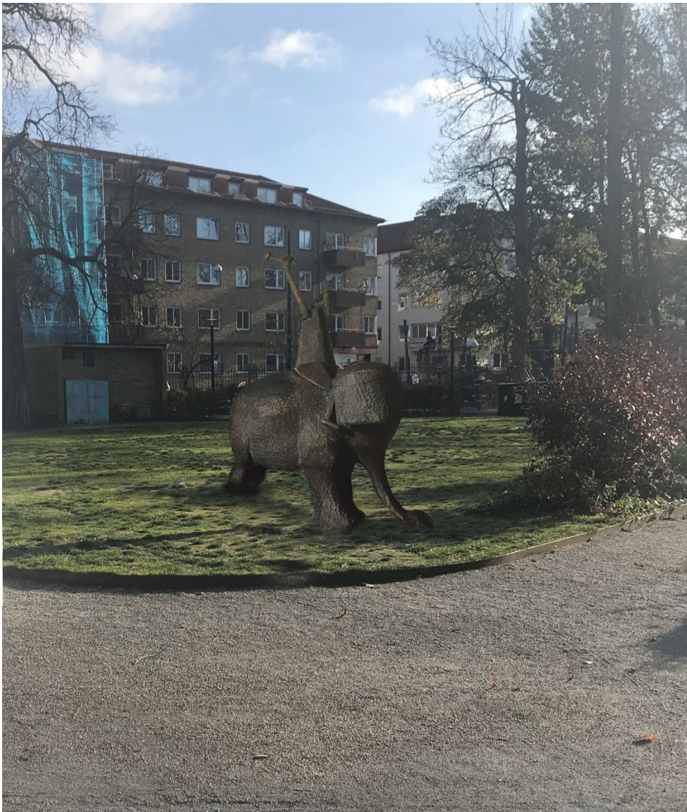
Kollage över elefanten