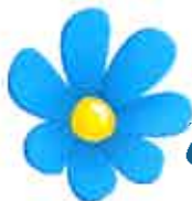
med instämmande av: Anders Pripp (SD)

Sverigedemokraterna Trygghet & Tradition