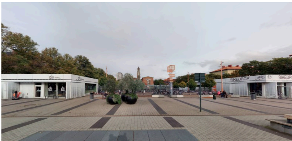
Gatubild från 2021 (Cyclomedia), med vy över planområdet från den södra stationsnedgången till Triangelns station.