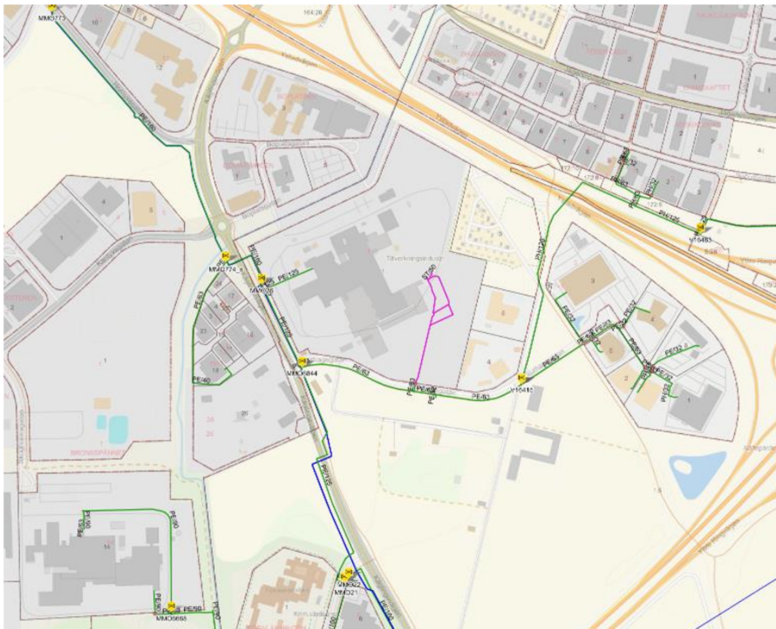
Bild hämtad från yttrande. Blå sträckning = högtrycksledning, grön sträckning = distributions- och servisledning, rosa sträckning = avkopplad ledning.

Det är viktigt att samråd sker med Nordion Energis områdeshandläggare redan i tidigt projekteringsskede, speciellt om arbete sker i närheten av gasledningen.