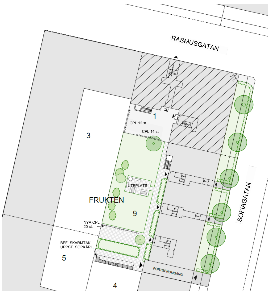
Figur 3. Illustration som visar möjligt förslag till gårdsuprustning för fastigheterna Frukten 1 och 9. Bland annat tillförs nya cykelparkeringsplatser.