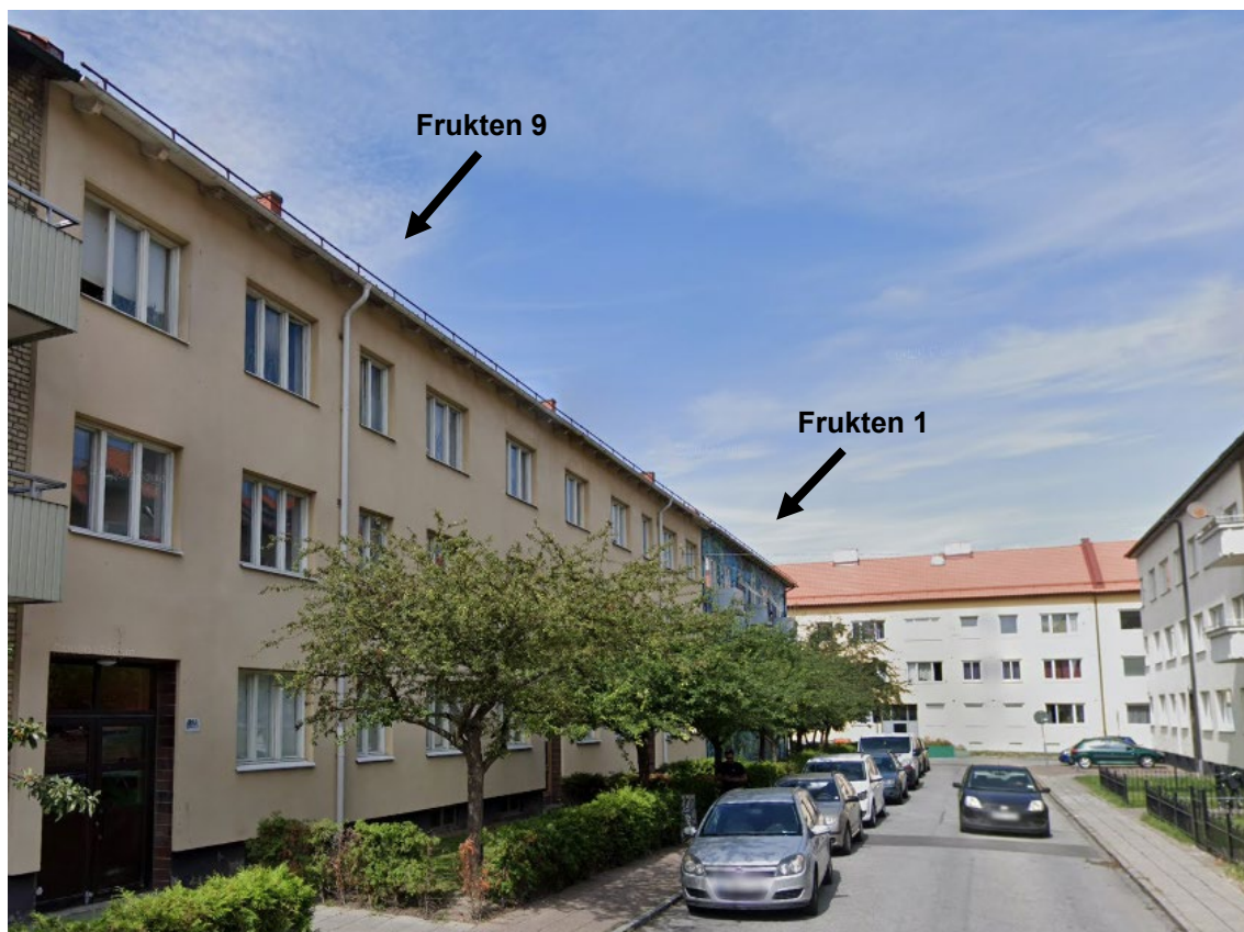
Figur 7. Vy från Sofiagatan, från sydost.

Området präglas av 1930-talets malmöitiska arkitekturutveckling innehållande slutna kvarterbebyggelse. Byggnaderna inom kvarteret Frukten är uppförda med fasader i puts och tegel samt har sadeltak i rött lertegel. Byggnadernas karaktär är av kulturhistoriskt värde, eftersom de ingår i ett större område med byggnader från samma tid och med liknande arkitektur. Omgivande bebyggelse med fasader ut mot Rasmusgatan och Sofiagatan har liknande tegeltak. Takkuppor finns längs med Rasmusgatan och Sofiagatan.