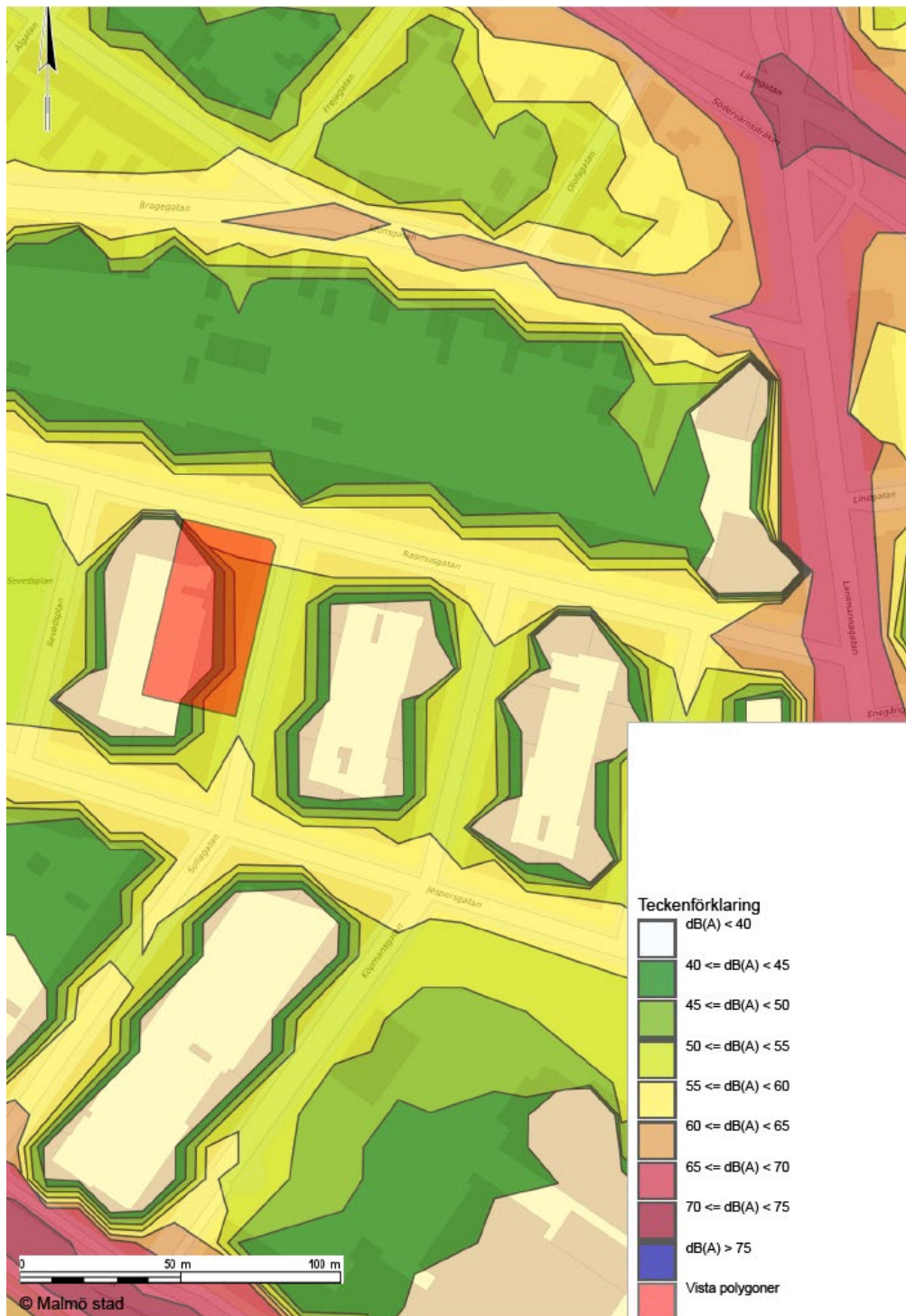
Figur 4. Beräknade ekvivalenta bullernivåer från väg (dB(A)) 2 meter ovan mark. Ekvivalenta nivåer innebär medelljudnivåer. Ytorna är förenklade. Planområdet är markerat i rött. Källa: Miljöförvaltningen, Malmö stad (2021).

Fastigheterna ligger skyddade från större trafikleder och gator. Trafikbullernivåer bedöms inte överskridas, eftersom tillkommande bostäder är belägna högst upp i huset. Gården är kringbyggd och uteplatser är belägna på gården.