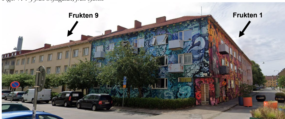
Figur 8. Vy från Rasmusgatan, från nordost.