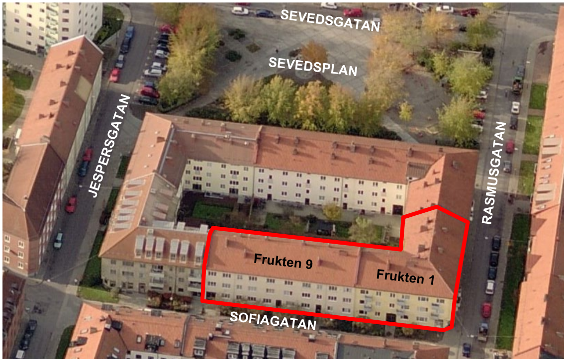
Figur 5. Område där ändring av detaljplanen görs markerad med röd linje. Frukten 1 och 9 längs med Rasmusgatan och Sofiagatan.