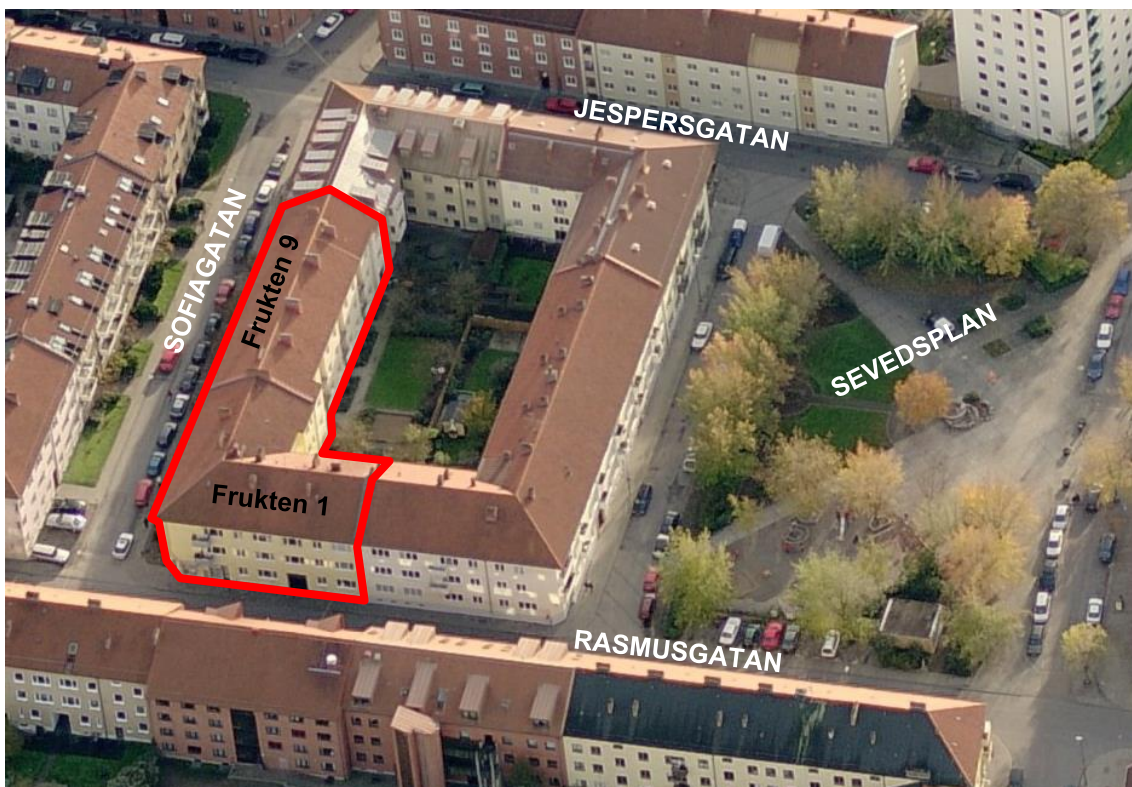
Figur 6. Område där ändring av detaljplanen görs markerad med röd linje. Frukten 1 och 9 längs med Rasmusgatan och Sofiagatan.