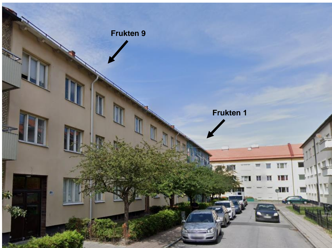
Figur 7. Vy från Sofiagatan, från sydost.

Området präglas av 1930-talets malmöitiska arkitekturutveckling innehållande sluten kvarterbebyggelse. Byggnaderna inom kvarteret Frukten är uppförda med fasader i puts och tegel samt har sadeltak i rött lertegel. Byggnadernas karaktär är av kulturhistoriskt värde, eftersom de ingår i ett större område med byggnader från samma tid och med liknande arkitektur. Omgivande bebyggelse med fasader ut mot Rasmusgatan och Sofiagatan har liknande tegeltak. Takkuppor finns längs med Rasmusgatan och Sofiagatan.