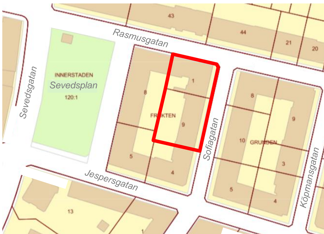
Orienterings- och fastighetskarta med planområdet markerat med röd, heldragen...

Ändring av detaljplan för fastigheterna Frukten 1 och 9 i Södra Sofielund i Malmö