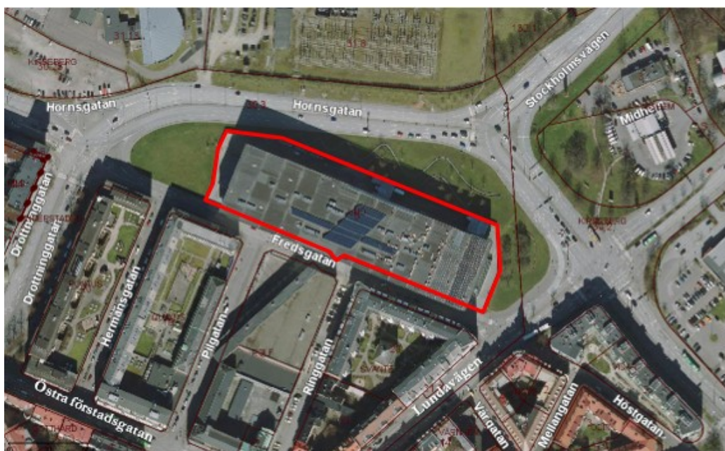
Figur 3. Ortofotograf som visar fastighetsgränser med planområdet markerat i rött.

Inom planområdet finns i dag köpcentret Entré med ett utbud inom handel, upplevelser och andra verksamheter.