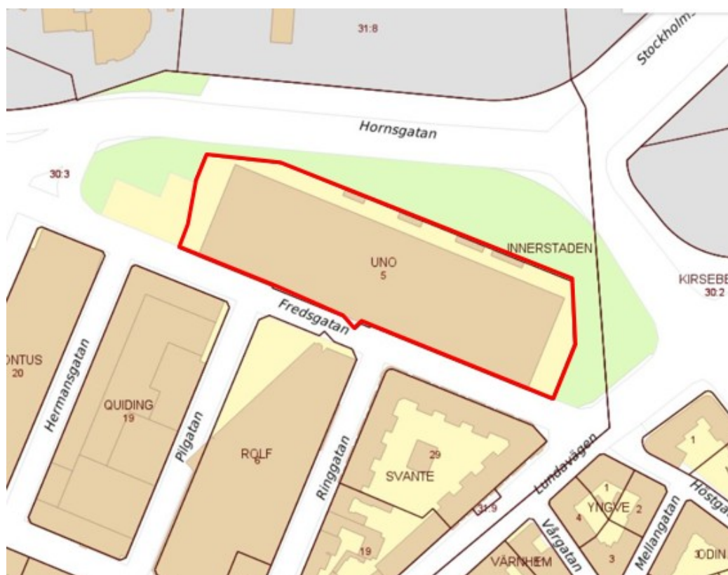
Figur 1. Område som berörs av ändringen är markerad med röd linje.

Planändringen motiveras av att den skapar förutsättningar för ytterligare verksamheter inom fastigheten, gynnar näringslivet och skapar fler arbetstillfällen i Malmö. Planändringen motiveras också av att skapa bättre service för boende på och omkring Värnhem.