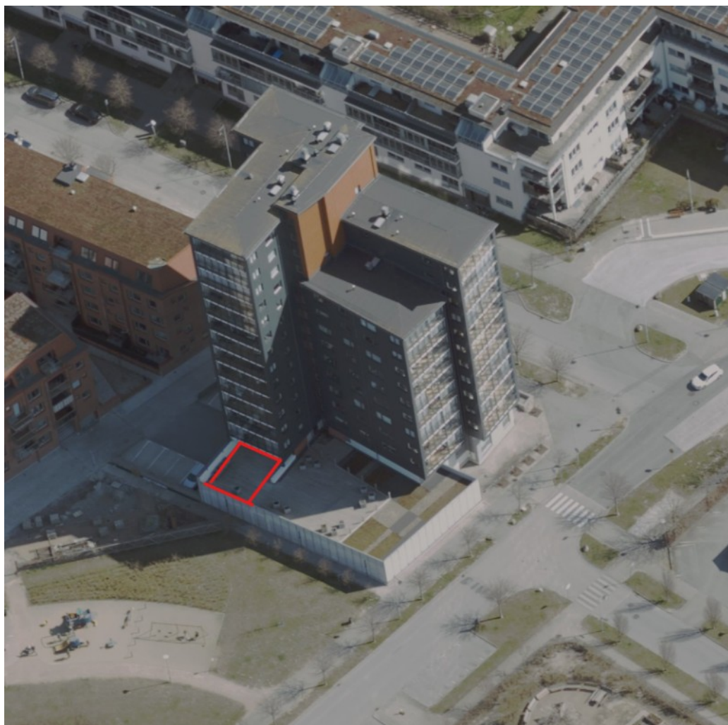
Område inom vilket det föreslås en tillbyggnad i form av en vinterträdgård. Markerat med rött.