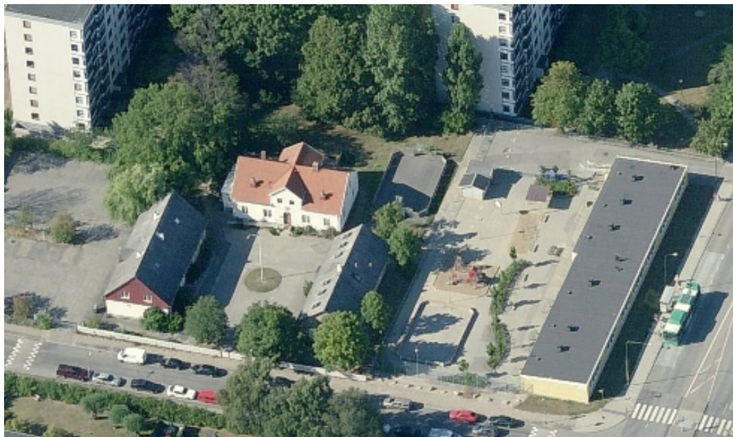
Flygfoto över fastigheten Parsifal 5