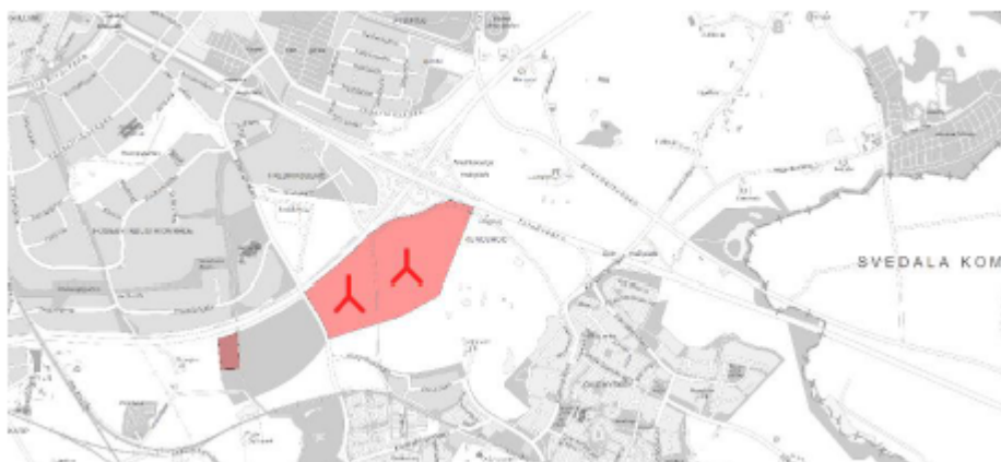
Bild 1. Kartbild över aktuellt område som föreslås för etablering av vindkraftsanläggning inklusive placering av respektive vindkraftverk. Det rödmarkerade området är utpekad i Översiktsplan för Malmö som lämpligt för etablering av vindkraftverk.