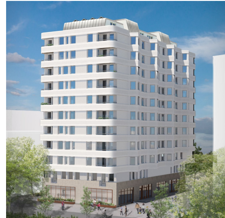
Vy från sydost – fasader åt söder och öster

Förslaget har prövats för liten godtagbar avvikelse avseende trafikbuller samt markens användning och in- och utfartsförbud (PRH på Ögla 1).