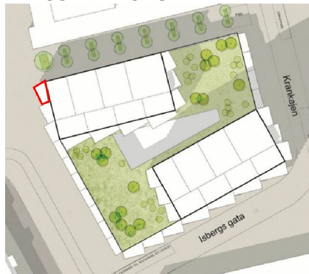
Illustration över byggnaden på Torrdockan 7. Röd markering visar aktuellt planområde och varför ytan behövs för att genomföra detaljplanen för Torrdockan 7.