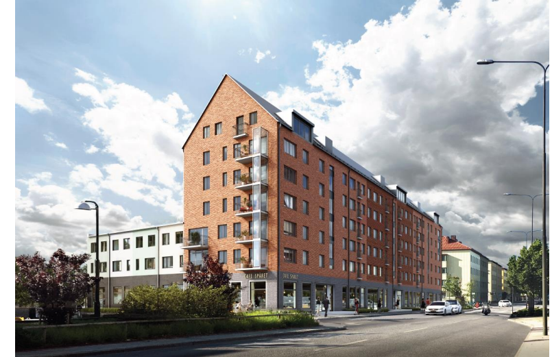
Vy från Nobelvägen

Fastighetens parkeringsbehov löses på den egna fastigheten.