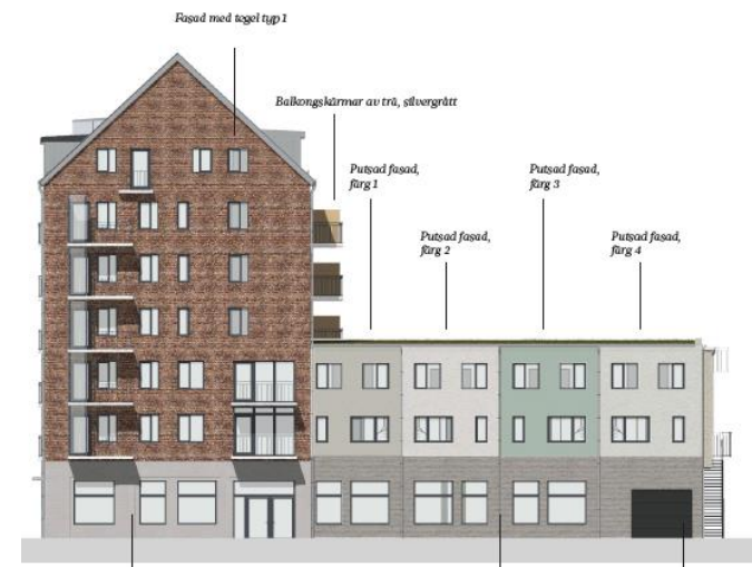
Fasad mot Celsiusgatan