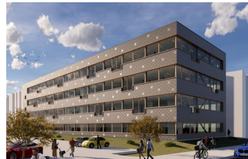
Vy från Cronquists gata, norr

Föreslagen åtgärd avviker från gällande detaljplan med avseende på totalhöjden. Takfoten är som högst belägen 15,5 meter från markens medelnivå, men därutöver finns två avluftshuvar vilkas höjd uppgår till 16,5 meter.