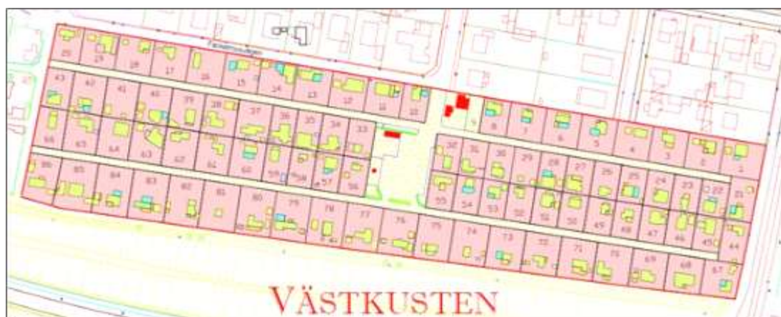
Kartan ovan visar Västkustens utbredning och indelning i lotter.

I den västra delen av planområdet sträcker sig en stor öppen gräsyta in mellan kolonierna och i sydväst finns en trädbevuxen slänt.