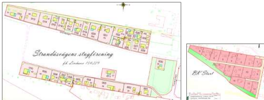
Kartorna ovan visar Strandåsens och BK Starts utbredning och indelning i lotter.

Inom planområdet finns idag de tre befintliga koloniområdena; Strandåsen med 30 kolonilotter; Västkustens koloniområde med 85 kolonilotter, samt brevduveklubben BK Start med 16 lotter. Kommunen arrenderar ut marken till föreningarna som i sin tur arrenderar ut mark till medlemmarna i föreningarna.