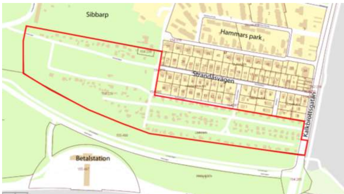
Översikts- och fastighetskarta med planområdet markerat med röd linje

Detaljplan för fastigheten Limhamn 154:229 m.fl. i Sibbarp i Malmö