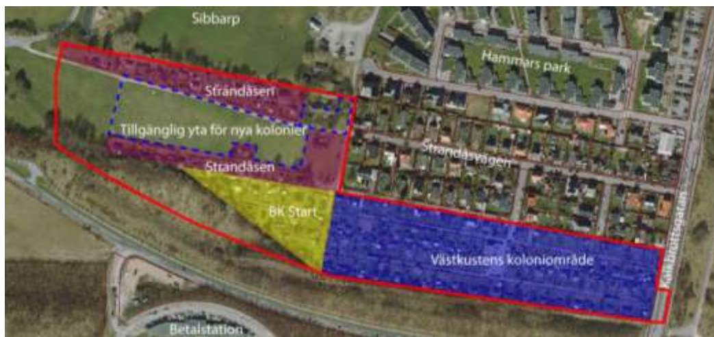
Planskiss som dels visar de befintliga koloniområdena Strändåsen, Västkusten och BK Start och dels en möjlig yta för ett nytt koloniområde. Planområdet är markerat med röd linje.

Planområdet som innefattar hela fastigheten Limhamn 154:229 är ca 10 hektar stort och ägs av Malmö kommun. I planområdet ingår även den lilla fastigheten Limhamn 154:238 som är privatägd. Planområdet är ca 800 m långt och som mest ca 200 m brett.