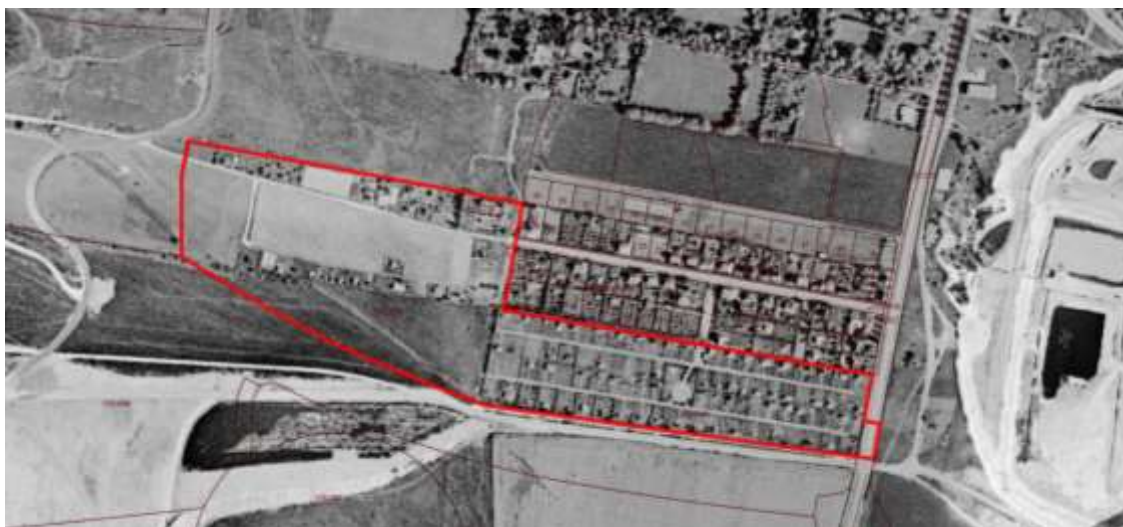
Flygfoto från ca 1960 med planområdet markerat med röd linje.

Planområdet ligger i södra delen av stadsdelsområdet Sibbarp. Sibbarp präglas av en heterogen bebyggelse av olika ursprung där det är variationen som ger karaktären.