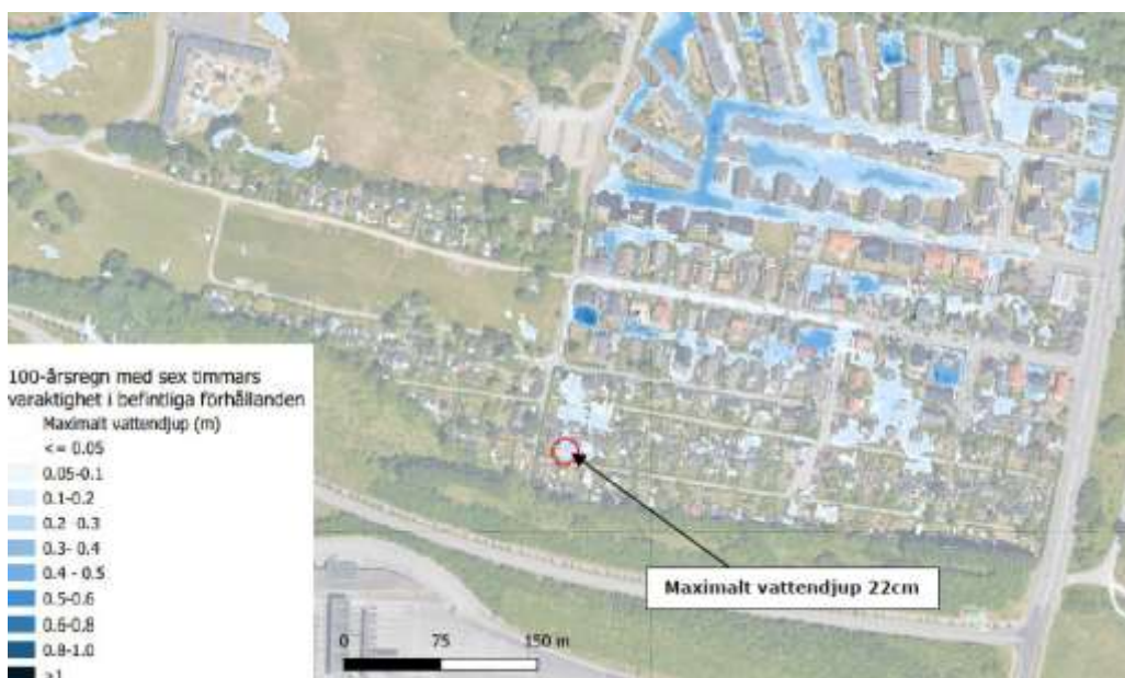
Kartan visar översvämningssituationen vid dagens skyfall med befintliga förhållanden.

För att ta fram en skyfallsmodell som är mer sanningsenlig har infiltrationskapaciteten anpassats utefter insamlad information från intervjuer och platsbesök. Det vill säga det resultat som beskriver översvämningssituation om ett skyfall skulle inträffa idag under befintliga förhållanden. Denna modell visas i kartan nedan.