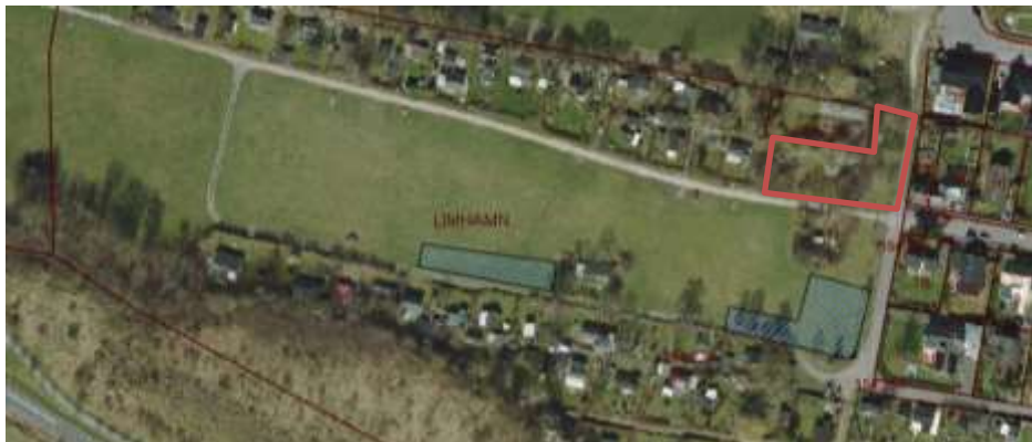
Kartan visar placeringen av de båda fornlämningsområdena (blåskräfferade) som har undersökts inom planområdet, samt trädgårdstomten (rödmarkerad) som har relativt höga naturvärden.

Enligt Riksantikvarieämbetets finns det två mindre fyndplatser på den stora gräsytan som är klassade som övriga kulturhistoriska lämningar. Inom de båda områdena har det påträffats bränd flinta samt träkol. I öster sammanfaller fyndplatsen med strandvallsbildningen Järavallen. Fynden har tillvaratagits. (RAÄ dnr 321-1611-2005). Länsstyrelsen har meddelat att inga ytterligare arkeologiska utredningar är nödvändiga.