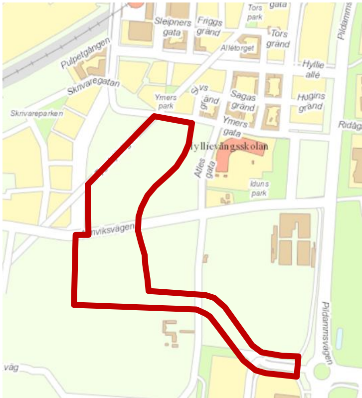
Kartan ovan visar planområdet inom röd linje.